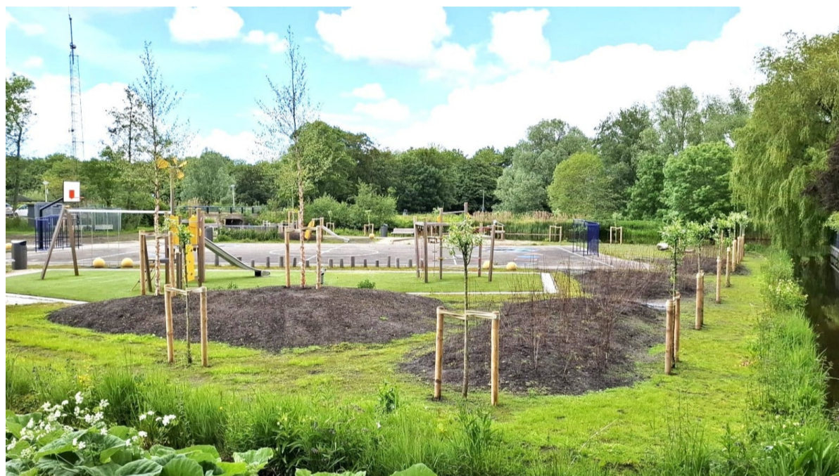
Het terrein op de hoek van de Osdorperweg en de Joris van den Berghweg in Oud Osdorp is onherkenbaar omgetoverd in een aangenaam groene plek om te verblijven en herbergt veilige speeltoestellen.

Het stichtingsbestuur: "Wees welkom, zorg dat je erbij bent en kom vooral op de fiets!"