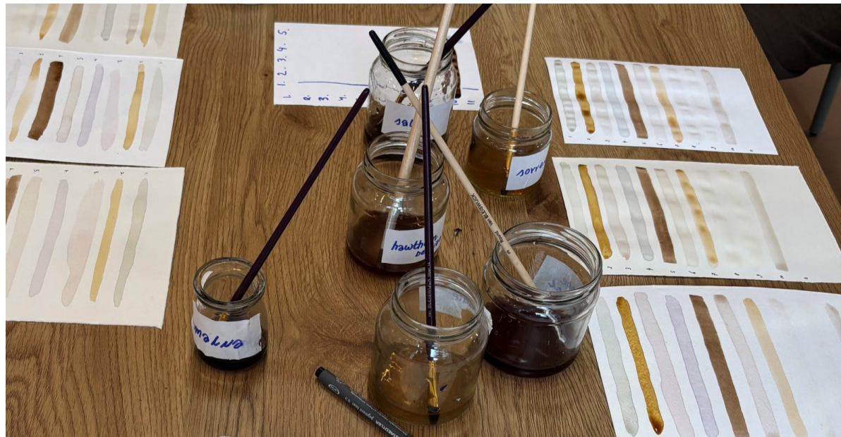
Onderdeel van de workshop: het onderzoeken en vastleggen van inkten van diverse planten op verschillende soorten papier.