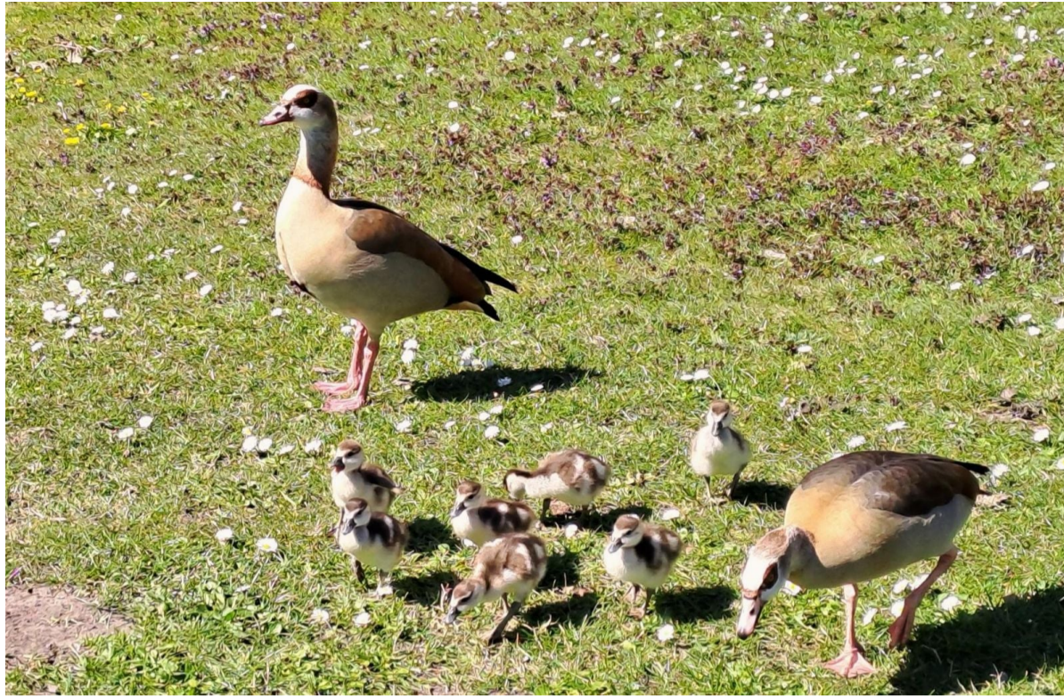
Op en rond het weiland naast Natuurpark Vrije Geer op Sloten verkent de familie Nijlgans de omgeving. Nu de Vrije Geer rond het weiland autoluw is, kunnen ze ook met z'n allen veilig oversteken.