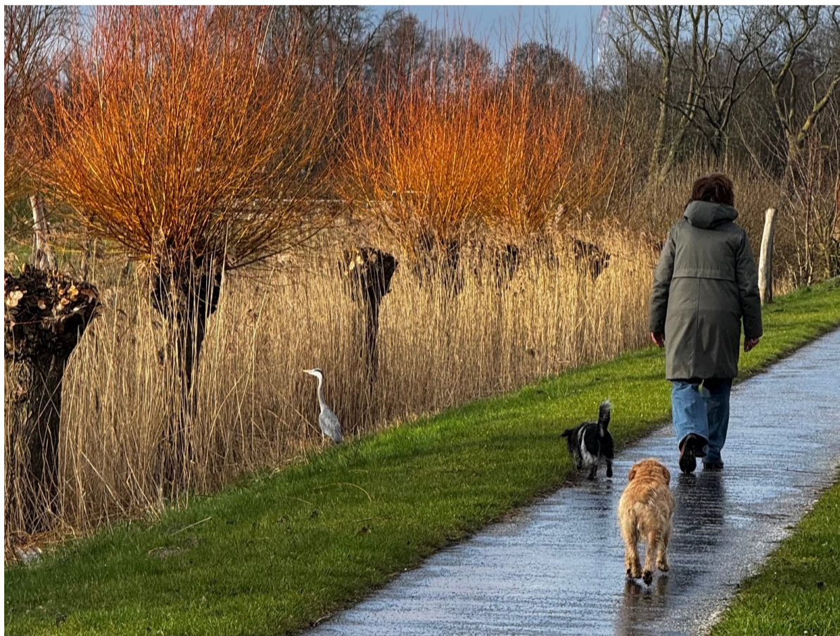
Inmiddels zijn de knotwilgen langs de sloot naast de speeltuin op de Polderheuvel in Oud Osdorp vast alweer uitgelopen. De gemeente knot niet alle wilgen tegelijk, zodat insecten nectar en stuifmeel kunnen blijven verzamelen. Vogels vinden bovendien bescherming tussen de takken.