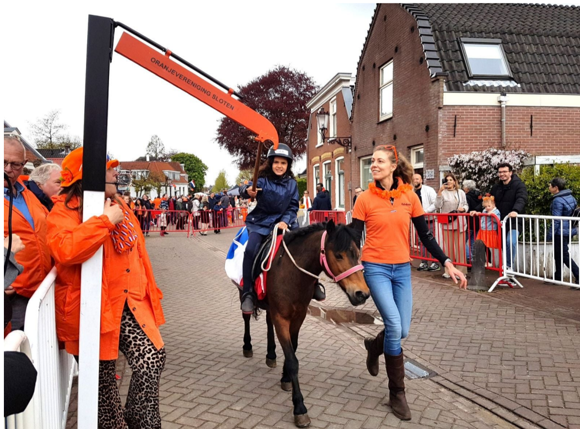
De amazones van Manege De Ruif van de Sloterweg nemen vanaf 12 uur deel aan de ringsteekwedstrijden.

Het moge duidelijk zijn dat het dorp Sloten op deze feestdag van 06 tot 22 uur is afgesloten voor al het doorgaande verkeer. Ook fietsers kunnen omrijden via de Ditlaar en Vrije Geer. De organisatie verzoekt iedereen zo veel mogelijk te voet of met de fiets naar Sloten te komen.