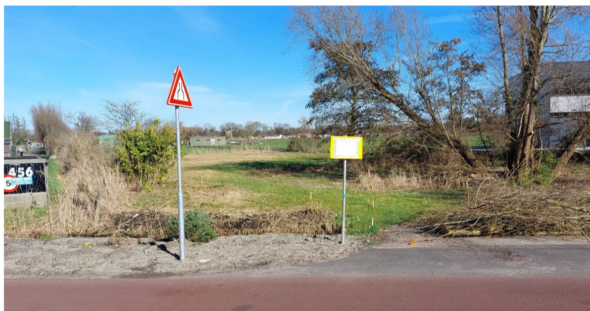
Osdorperweg 454: De voorgenomen bestemming als woonwagenlocatie is na rechterlijke uitspraak zes weken geschorst. Gewacht wordt nog op de definitieve uitspraak.

Inmiddels is bekend dat het hier gaat om een gezin dat moet verhuizen vanwege de bouw van de nieuwbouwwijk Sluisbuurt aan de oostkant van Amsterdam. Omwonenden en ondernemers – met aangrenzende bedrijven – hebben dit besluit bij de rechter aangevochten. De gemeentelijke beslissing om hier een woonwagenkamp van te maken is door de rechter met ten minste zes weken opgeschort. De definitieve uitspraak van de rechter – en dus hoe deze kavel zal worden ingevuld – is nog niet bekend.