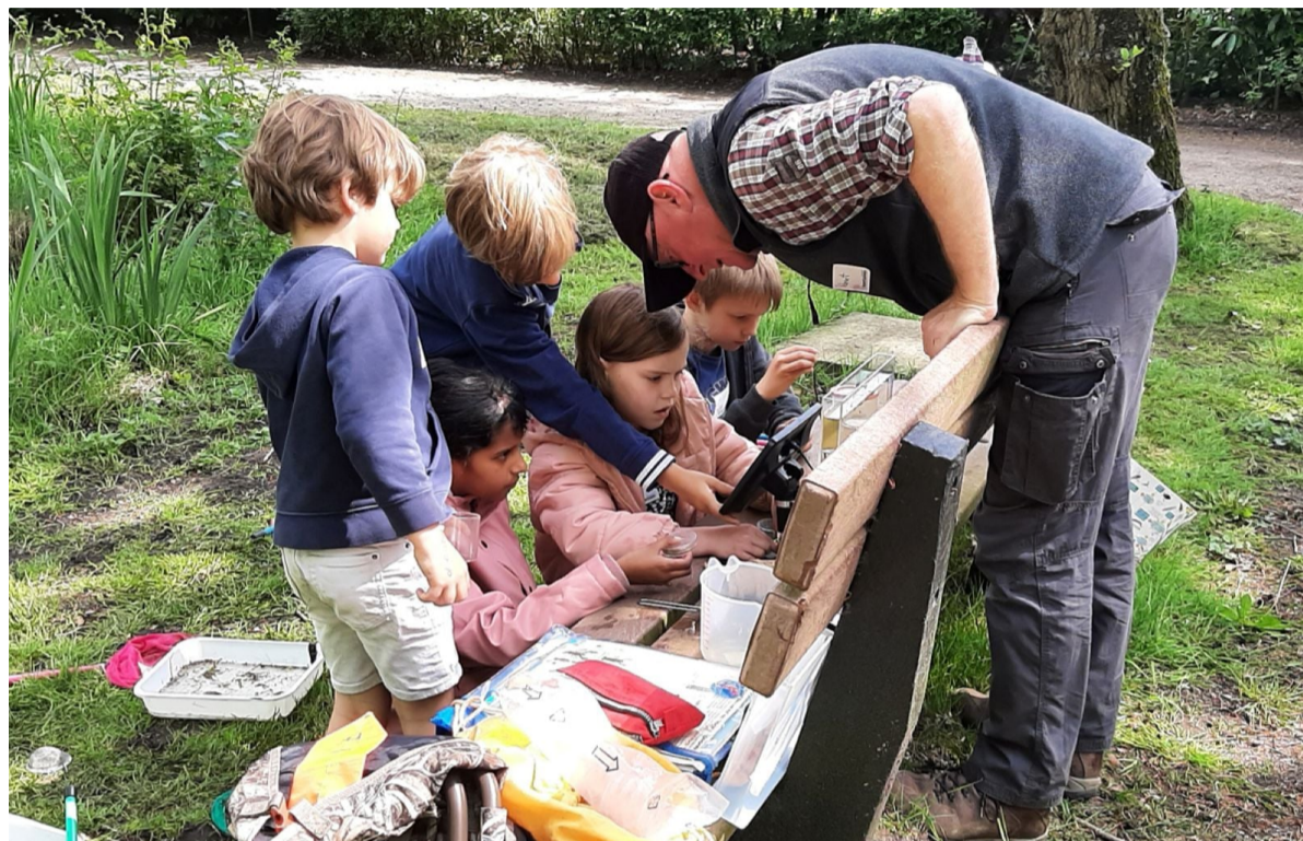
De kinderen proberen vast te stellen welke waterdiertjes ze in hun netten hebben gevangen.