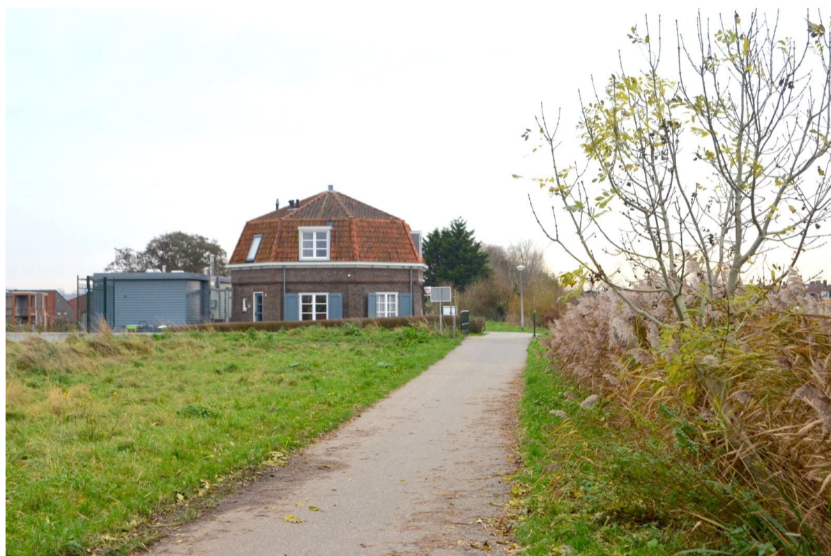
De eindbestemming van de jubileumfietstocht: de Aker molen.

Mocht u op vrijdag 3 april geen tijd hebben om deze fietstocht te rijden, dan is deze route uiteraard ook op andere momenten te volgen. Met ingang van 4 april is het Politiebureautje weer op weekenddagen van 11.00 tot 14.00 uur geopend en daarnaast op verzoek .