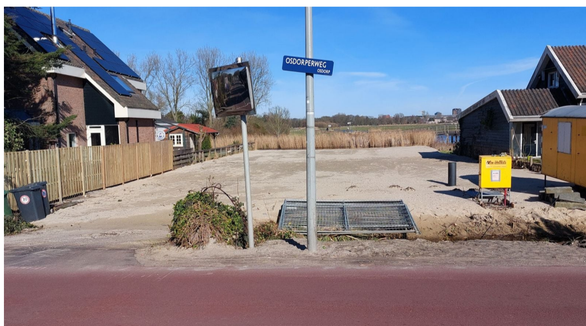
Osdorperweg 634: In afwachting van vervangende woningbouw is hier nu nog een fraai doorkijkje naar het achterliggende landschap van de Osdorper Binnenpolder.

Op dit moment rest op de plek van die eens zo mooie voortuin alleen nog een zandvlakte met een fraaie doorkijk naar het achterliggende polderlandschap. Om die doorkijkjes op nog onbebouwde plekken langs de Osdorperweg in stand te houden staat het bestemmingsplan daar geen woningbouw meer toe. Uiteraard geldt dit niet voor deze kavel. Het gaat hier immers om vervangende woningbouw.