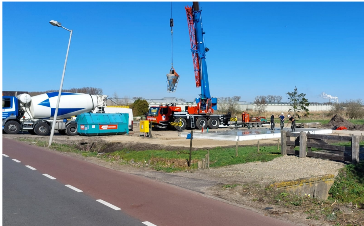
Osdorperweg 536-538: Ondanks strijdigheid met bestemmingsplan heeft de rechter bepaald dat hier twee huizen mogen verrijzen.