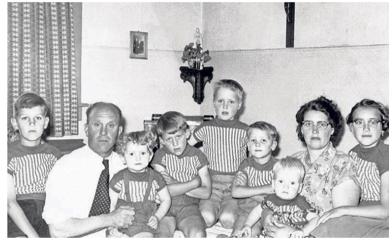
De familie Kroes.

De meeste bewoners spraken graag over hun verleden aan de Osdorperweg. „Vaak heel openhartig ook. Als ze de tekst dan voor controle terugzagen, schrokken ze soms. In een enkel geval leidde dat tot wat zelfcensuur. Dan drong ik wel aan met: 'Waarom zou je dit schrappen? Het is een prachtig verhaal', en dan gingen ze vaak toch akkoord. Maar niet altijd, en