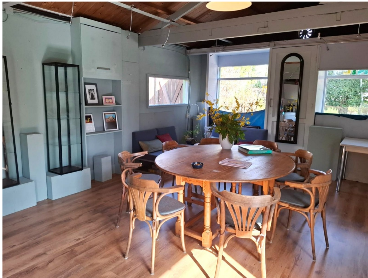
Galerie Eigen Hof in afwachting van kunst uit de buurt. Bent u tuinder op een van de Slotense of Oud Osdorpse volkstuinparken? Woont u op Sloten of in Oud Osdorp, Nieuw Sloten, De Aker of elders in de buurt? Neem contact op met Ans en Lies.