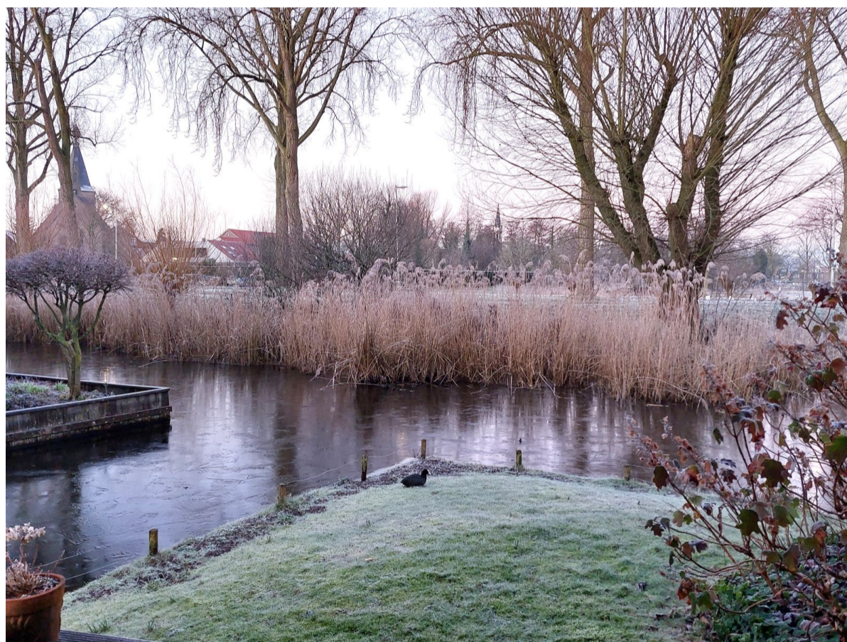
Winters uitzicht op Sloten vanaf Kortrijk in Nieuw Sloten.

De werkgroep Dorpshuis-tuin heeft op 11 januari met vereende krachten een partij zand naar de tuin gebracht. Sommige delen van de tuin liggen namelijk te laag. Eerder al hadden werkgroepleden een deel van de tuin afgeplagd. Dit was nodig om de Kruijpende Boterbloem terug te dringen. Die verdrong andere planten. Hierna zal de tuingroep op het schone zand ook nog een laag tuinaarde aanbrenge. Tot slot volgt nieuwe beplanting. Doel van dit alles? Een grotere variatie van de bloeiers in de tuin achter het Dorpshuis. Vergeet komend seizoen vooral niet een kijkje te nemen in dit groene paradijsje. Van links naar rechts: Bea, Hella, Imke, Hans en Ria.