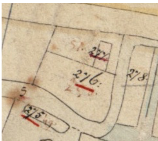
Uitsnede van een Minuutplan uit 1832: Sloterweg 711-715.