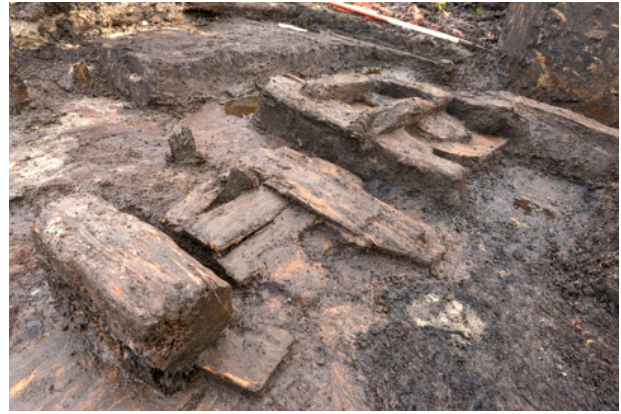
De oudste (16e-eeuwse) fase van het complex.

De van tevoren hoge verwachtingen van de opgraving - die plaatsvonden in januari 2021 - werden bevestigd. Al vlak onder het maaiveld werden de eerste archeologische sporen gevonden. Het veldonderzoek heeft informatie opgeleverd over de inrichting en het gebruik van het complex vanaf de late 16e eeuw tot en met de late 19e eeuw. De oudste gevonden resten dateren uit de tweede helft van de 16e eeuw. In die tijd werd de veenweide bouwrijp gemaakt door rietmatten te plaatsen en het terrein op te hogen met klei, veen en afval. De fundering van de muren van een rechthoekig gebouw van ongeveer 3 bij 6 meter bestond uit brede liggende planken met daarop houten balken en liggers. Deze eerste fase van bebouwing, met mogelijk een agrarische functie, werd omstreeks 1600 afgesloten met een brandlaag. Hieronder ziet u een aantal foto's die archeoloog Thijs Terhorst in januari 2021 van de opgravingen maakte.