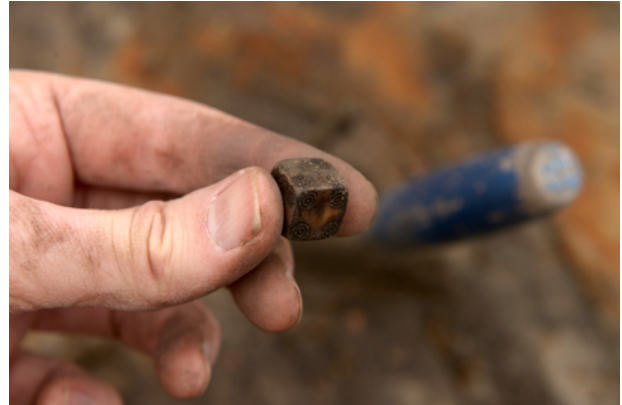
De archeologen troffen deze 17e-eeuwse benen dobbelsteen aan in de ruimte rond de haardplaats / gelagkamer van de herberg.