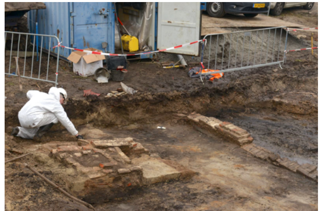
De ruimte rond de 17e-eeuwse centrale haardplaats van de herberg wordt vrijgelegd.