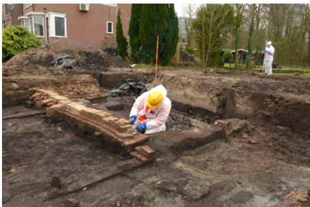
De noordmuur van het 18e-eeuwse stalgebouw wordt vrijgelegd.

twee afvalputten, waarvan een met een kleine hoeveelheid botten van schapen / geiten, die hier kennelijk werden gehouden.