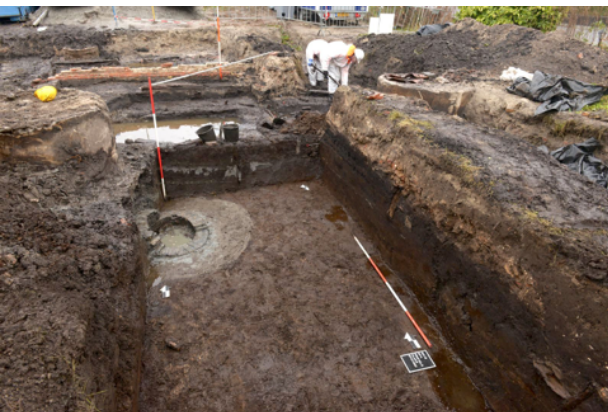
De 17e-eeuwse waterput van de herberg met daaromheen een mantel van klei en zand.