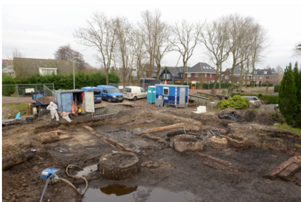
Overzichtsfoto van het herbergstalcomplex met rechts het oostelijke gebouw met waterput en links het westelijke gebouw met haardplaats

Vervolgens liet de toenmalige eigenaar van het terrein in 1873 - 1874 de resterende bebouwing op het terrein slopen en vervangen door de drie bekende landarbeiderswoningen onder één dak. Hoewel de resten van deze gebouwtjes voorafgaand aan het veldonderzoek reeds waren gesloopt, bleken er ook archeologisch geen aanwijzingen voor een bouwkundige relatie tussen de drie woningen en de oude herberg of daaropvolgende stal. Wel gerelateerd aan de landarbeiderswoningen was een laat 19e-eeuwse / vroeg 20e-eeuwse afvalstort in een gemetselde bak op het achterterrein. Hier zijn enkele beeldjes van biscuitporselein gevonden die goed vallen te plaatsen in het van oudsher katholieke milieu van de tuinders aan de Sloterweg.