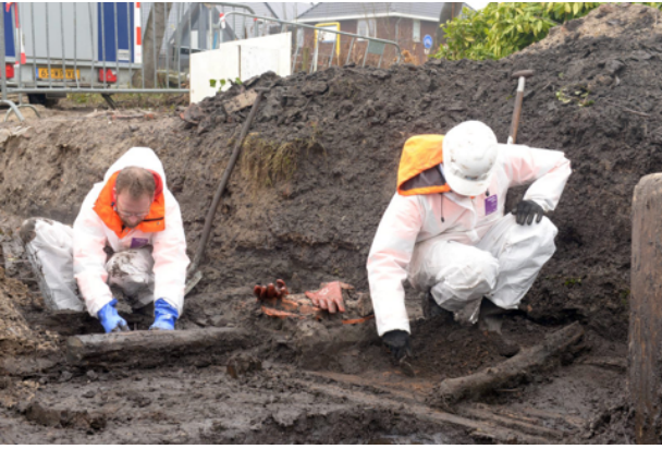
De 17e-eeuwse houten fundering van het oostelijke herberggebouw wordt vrijgelegd.