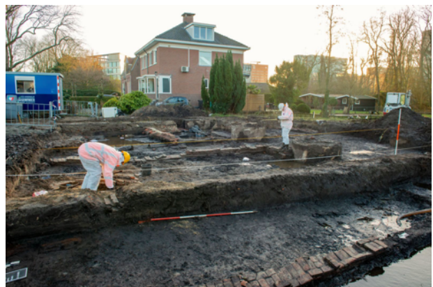
Het 17e-eeuwse herberggebouw wordt ingemeten.

In de vroege 17e eeuw volgden grootschaliger ophogingen van het terrein met klei, veen en afval. De bestaande bebouwing werd uitgebreid, waardoor twee rechthoekige panden van 11 x 6,75 meter tot stand kwamen, gelegen haaks op de Sloterweg. Beide zijn archeologisch gedateerd in het tweede kwart van de 17e eeuw. Deze bevindingen stemmen overeen met kaarten uit 1675 en 1678. Het daarop afgebeelde complex is aangeduid als 'de Ro(o) Leeuw'. Aan het gebouw werd in de tweede helft van de 17e eeuw een waterput en later een rechthoekige bak met onbekende functie toegevoegd. De Rode Leeuw (eerste vermelding 1635) was een historisch bekende plattelandsherberg, die door Claes Jansz Visscher (1587-1652) op een van zijn wandelingen door het buitengebied van Amsterdam werd getekend.