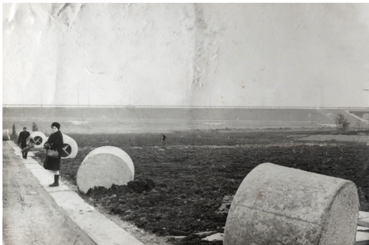
1968: Het nog kale terrein van Tuinpark Lissabon met op de achtergrond Rijksweg 4 naar Den Haag. De septic tanks voor de wc's in de nog te bouwen tuinhuisjes zijn afgeleverd, maar nog niet ingegraven. Een tuinder van het eerste uur: "Die krenge wogen ongeveer 650 kilo. We rolden ze met z'n allen naar onze kavels. Dan groeven we een diep gat waar we de gevaartes samen in lieten vallen."