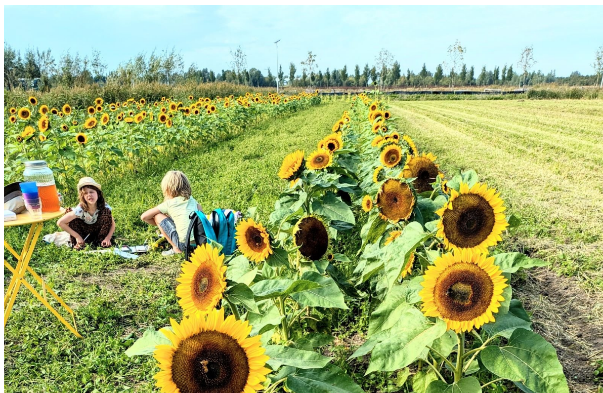
Zonnebloemen in de Lutkemeerpolder.

Iris Poels: "Samen hebben we een duidelijke visie over hoe we moeten omgaan met de schaarse vruchtbare grond van Amsterdam. Deze erkenning benadrukt onze gedeelde droom en geeft ons de hoop op nog meer politieke steun voor onze missie."