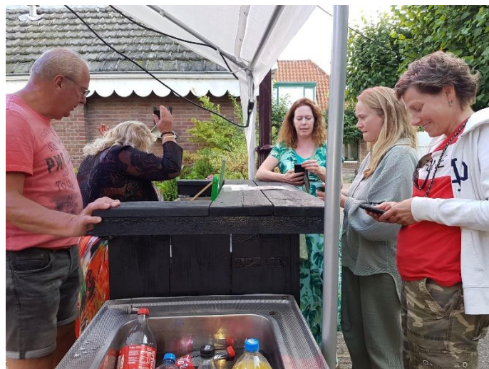
Muntjes digitaal of met papieren euro's aanschaffen...