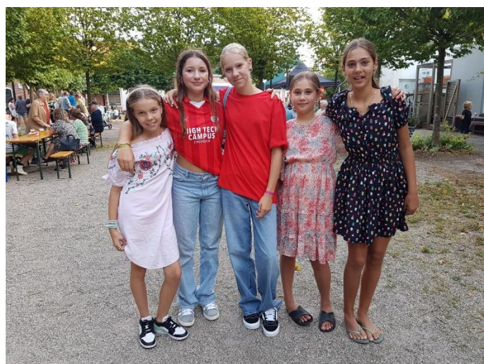
Blij om elkaar weer te zien...