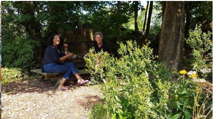
Vrijwilliger worden bij de Molen van Sloten of een aquarel van Sloten aanschaffen? Afkoelen met drankje in de weldadige Dorpshuis-tuin.