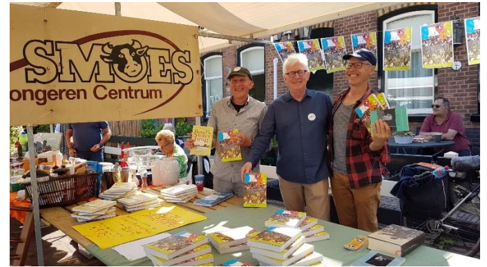
Wilt u als vrijwilliger meefietsen op de Duo-fiets? En: Boeken te koop over de bijzondere historie van Sloten en Badhoevedorp.