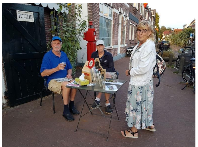
Welkom voor een praatje...