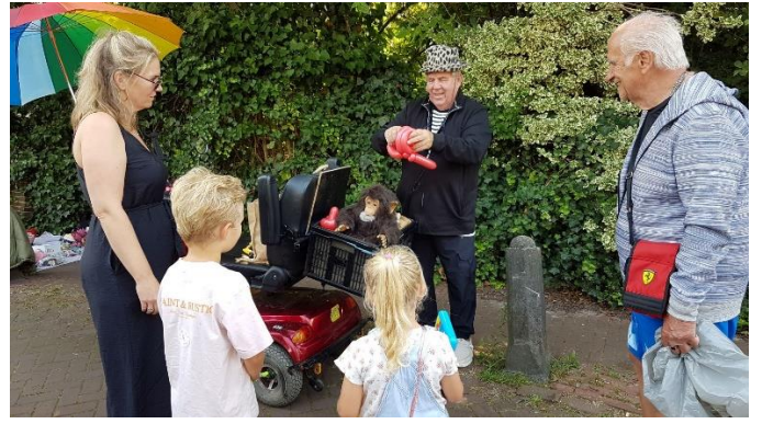
Gezelligheid op de braderie en een poedel van de Ballonnenclown.