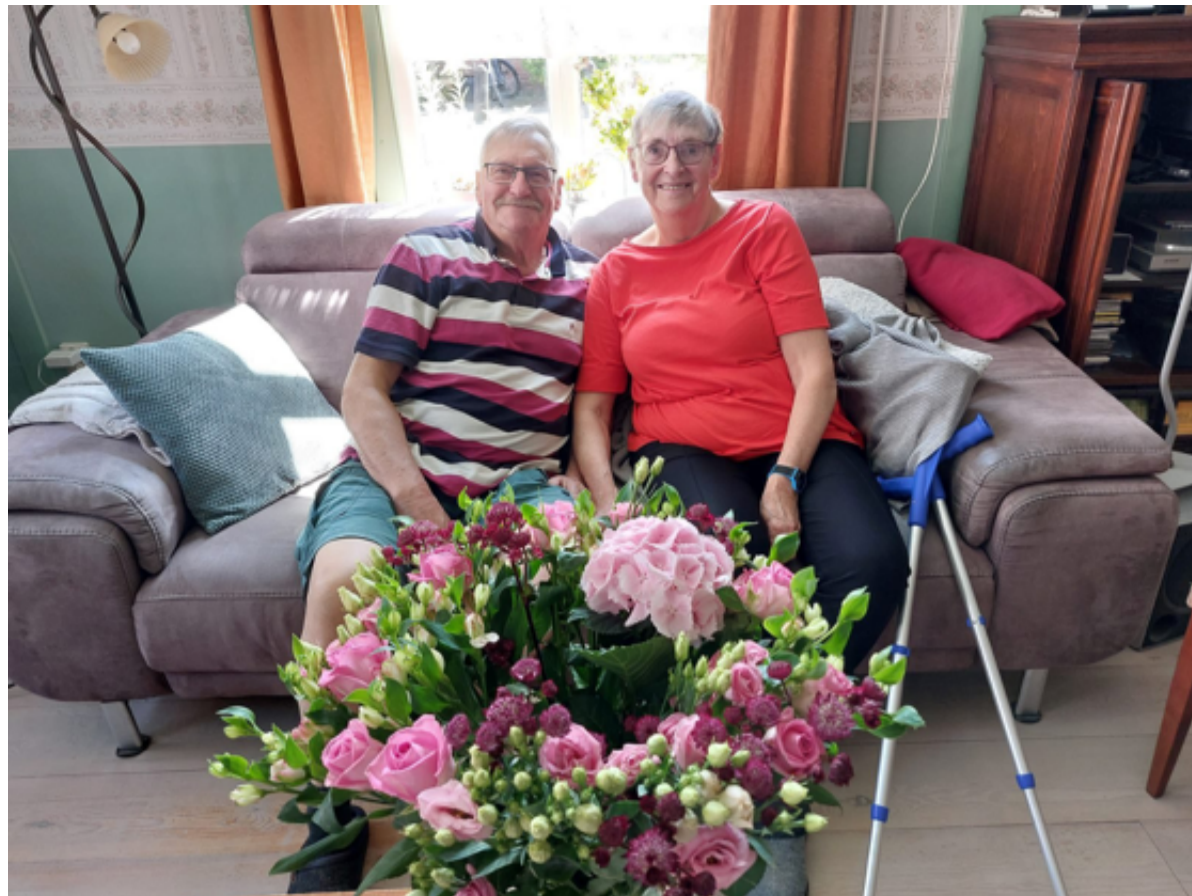
De werkgroep Dorpshuis Sloten verraste het jubilerende echtpaar met een grote bos bloemen en een dinerbon.