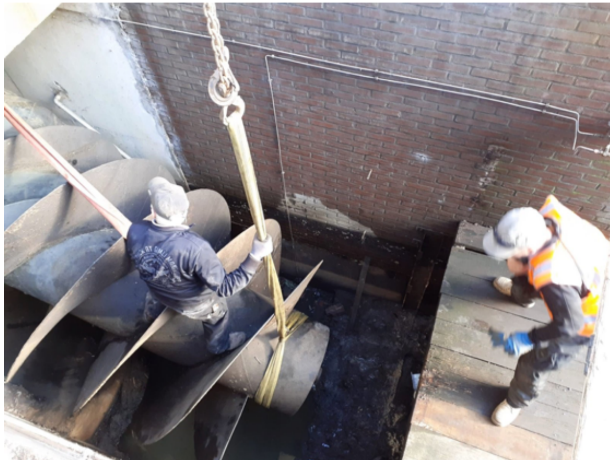
De vijzel wordt uit de watergang getakeld. Terwijl deze in de werkplaats van molenmaker Poland onder handen wordt genomen, zal het metselwerk in de vijzelkolom worden opgemetseld totdat deze de juiste diameter heeft voor de straks verkleinde vijzel.