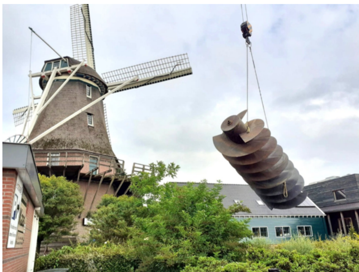
Het was een indrukwekkend schouwspel om die grote vijzel door de lucht te zien 'zweven'. Het loodzware en hier en daar verroeste molenonderdeel werd eerst op de grond geplaatst en daarna zorgvuldig op de speciale vrachtwagen gelegd waarmee hij werd afgevoerd.