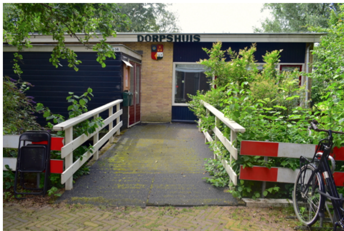
Entree van het Dorpshuis met de brug; 8 juli 2024.

Het landelijk gebied Sloten-Oud Osdorp in beeld