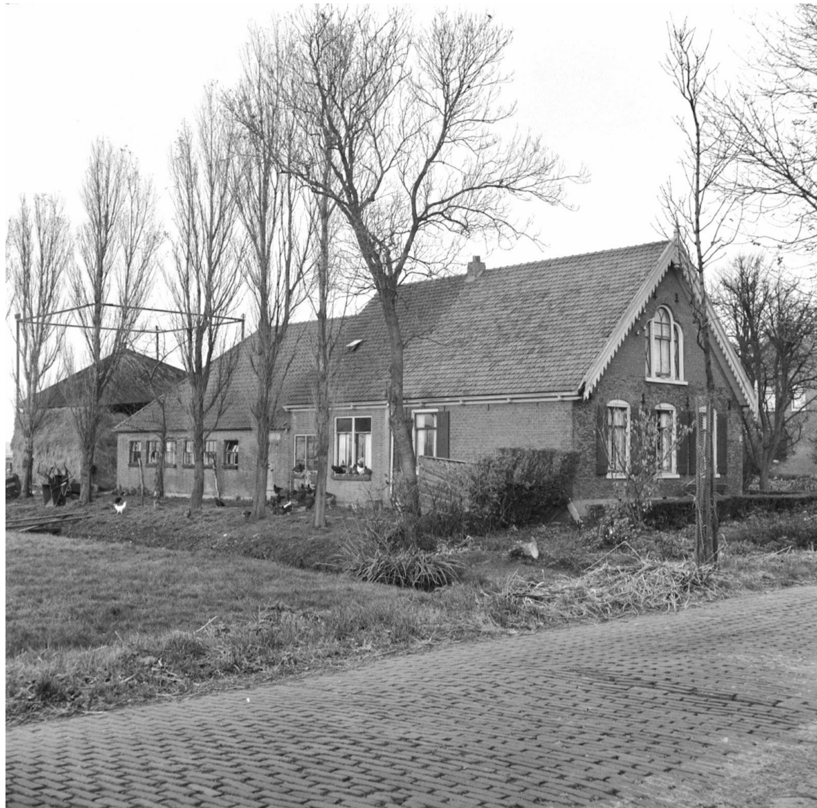
Boerderij 'De Bijweg' nog in vol bedrijf; november 1957.