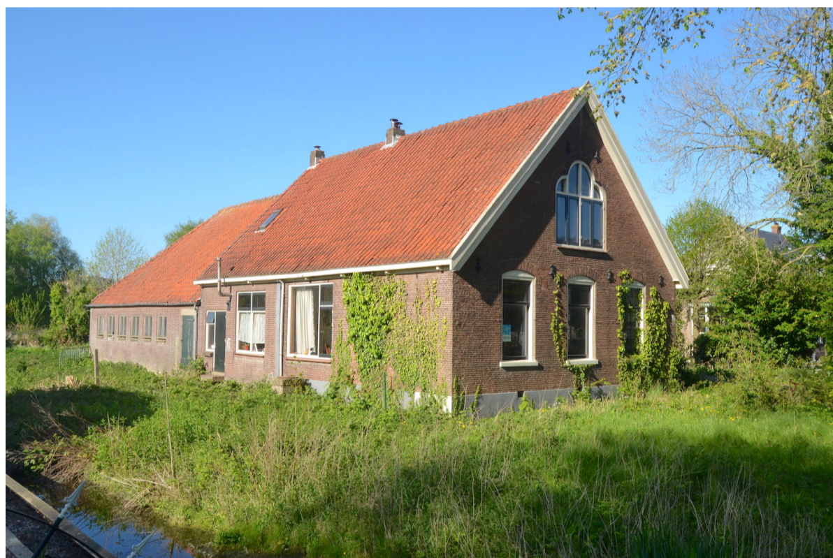
Boerderij 'De Bijweg' staat leeg in afwachting op betere tijden; 2 mei 2022.