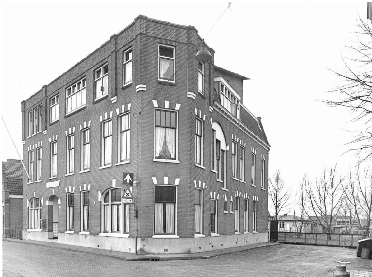
Het Wees- en Armenhuis van de voormalige gemeente Sloten gezien vanaf de Nieuwe Akerweg. Het latere dorpshuis (rechts) is nog niet gebouwd; er is nog een vrij uitzicht op de speeltuin. 20 januari 1959.

Zie ook het artikel uit 2021: Wees- en Armenhuis (1906) met zijn rijke historie kan er weer jaren tegen