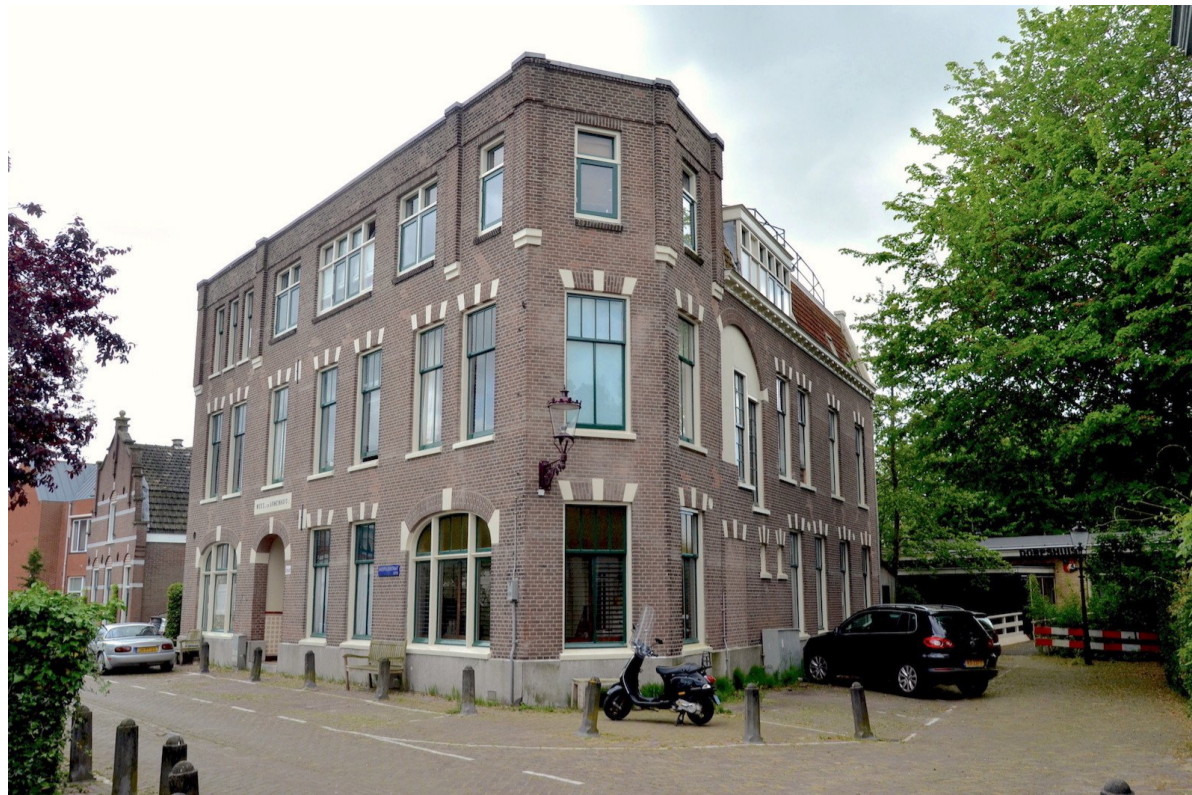
Het voormalige Wees- en Armenhuis aan de Akerpolderstraat 9 t/m 47. Rechts voorbij het geboomte van de Nieuwe Akerweg bevindt zich het Dorpshuis Sloten. 23 mei 2023.