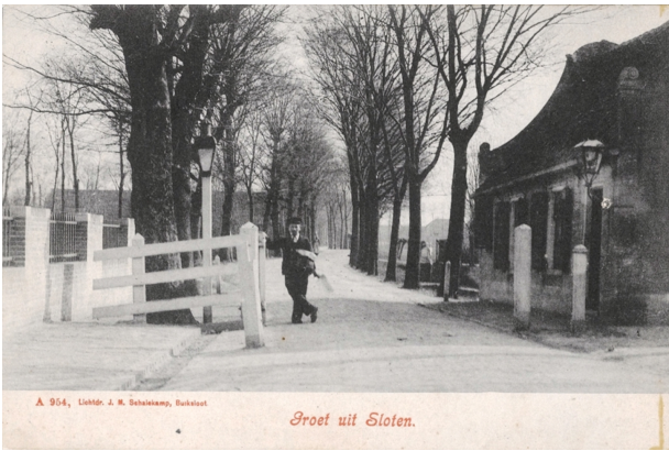
Tolhek aan de Sloterweg, Sloten. Rechts het oude tolhuis; circa 1900.

Het nabijgelegen Haarlemmermeer vormde een constante bedreiging voor de dorpen in het gebied. En dus ook voor Sloten. De zogenoemde Waterwolf slokte door de eeuwen heen grote stukken land op, waaronder de dorpen Rietwijk en Nieuwerkerk. Sloten bleef gelukkig gespaard. Tot de overstroming van 1836, waarbij het hele dorp tot aan de Haarlemmerpoort in Amsterdam onder water kwam te staan. Prompt werd besloten om het Haarlemmermeer in te polderen en de Waterwolf voor eens en altijd te verslaan.