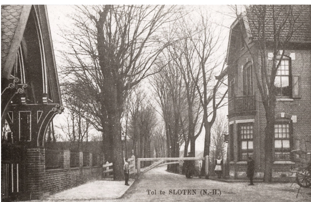
Tolhek aan de Sloterweg. Rechts het nieuwe tolhuis, Sloten; circa 1905.

Het nabijgelegen Haarlemmermeer vormde een constante bedreiging voor de dorpen in het gebied. En dus ook voor Sloten. De zogenoemde Waterwolf slokte door de eeuwen heen grote stukken land op, waaronder de dorpen Rietwijk en Nieuwerkerk. Sloten bleef gelukkig gespaard. Tot de overstroming van 1836, waarbij het hele dorp tot aan de Haarlemmerpoort in Amsterdam onder water kwam te staan. Prompt werd besloten om het Haarlemmermeer in te polderen en de Waterwolf voor eens en altijd te verslaan.