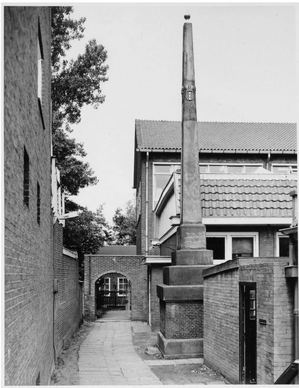
De banpaal uit 1794 aan de Sloterweg 1206; april 1984.

misdadigers op te pakken zonder inmenging van de landheren. En dus plaatste de stad ook banpalen in het gebied van Van Brederode. Op die banpalen was het wapen van Amsterdam met daarop een kroon te zien.