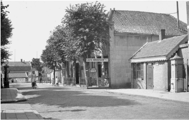
Het oude Rechthuis op Sloterweg 1230; 1928.

De geschiedenis van het geannexeerde dorp Sloten gaat verder terug dan de oprichting van de stad Amsterdam. Maar toch zijn de stad en het dorp al eeuwenlang nauw met elkaar verbonden. Hun gedeelde verleden werd bezegeld met een dobbelspel en de dronken overmoed van landsheer Van Brederode.