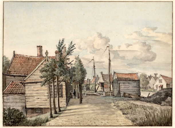
Het tolhek aan de Sloterweg (thans Sloterkade); 1817.

Sloten bestaat uit de Sloterweg (de Dorpsstraat), de Osdorperweg en een paar zijstraten en steegjes. In het witte monumentale huis tegenover de speeltuin woonde huisarts Faber, die in het koetshuis ook paarden behandelde. Bij de bakker kon je op de zaterdag voor Pinksteren speciale luilakbollen kopen. En aan de Sloterweg stond vroeger een tolhuis waar iedereen die vanuit Amsterdam het oude dorp in wilde, moest dokken. Het dorp is een herinnering aan nabuurschap, in de schaduw van de grote stad.