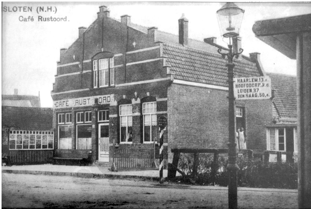
Café Rustoord aan de Akerweg A283 aan het begin van de 20e eeuw nog in de oorspronkelijke uitvoering. Rechts een wegwijzer voor de richtingen Haarlem (13,2 km), Hoofddorp (9,6 km), Leiden (37 km) en Den Haag (50,4 km).