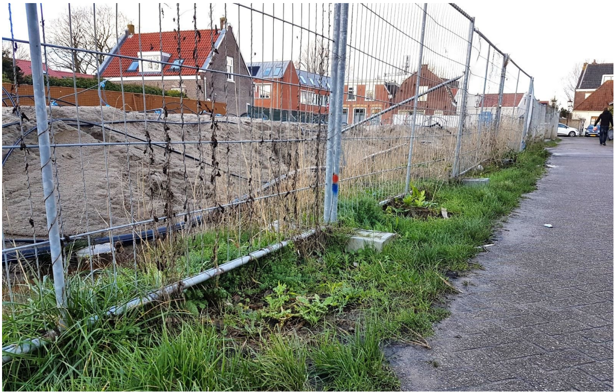
Foto genomen vanaf de Lies Bakhuyzenlaan. De acht nieuwe woningen zullen vanaf maaiveldniveau aflopend vanaf de Sloterweg worden gebouwd. Het overtollige zand zal dus worden afgevoerd.