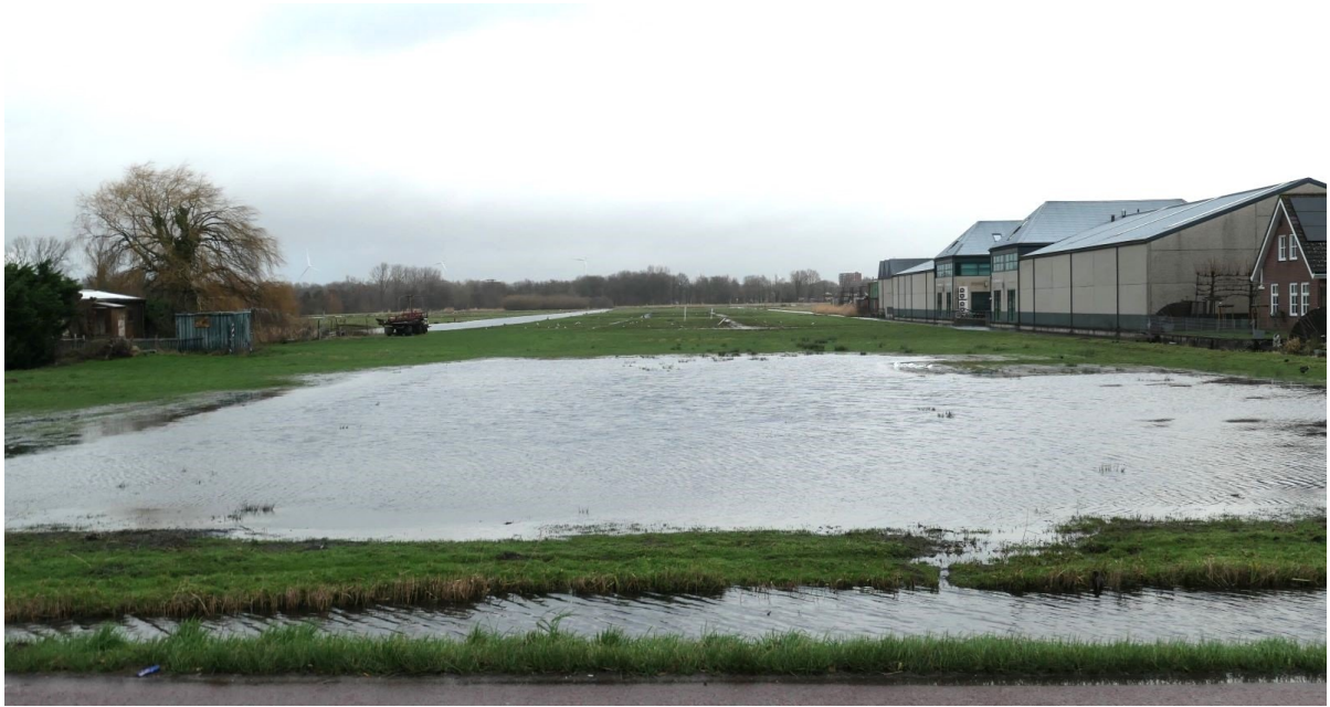
Hoge waterstand in de Osdorper Binnenpolder Zuid.