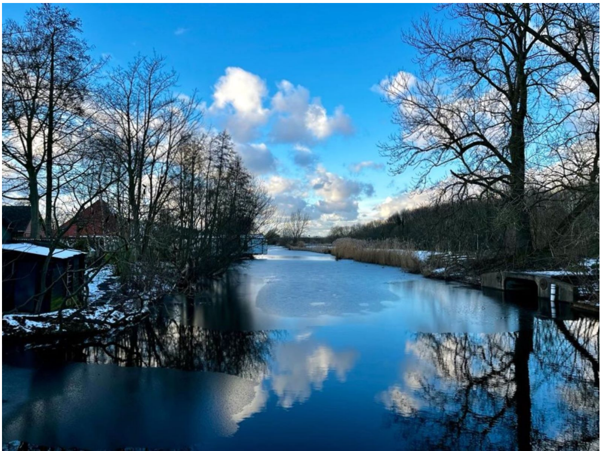
Drijvend ijs op de sloot die parallel loopt aan de Osdorperweg in Oud Osdorp met rechts de Osdorper Binnenvolter.