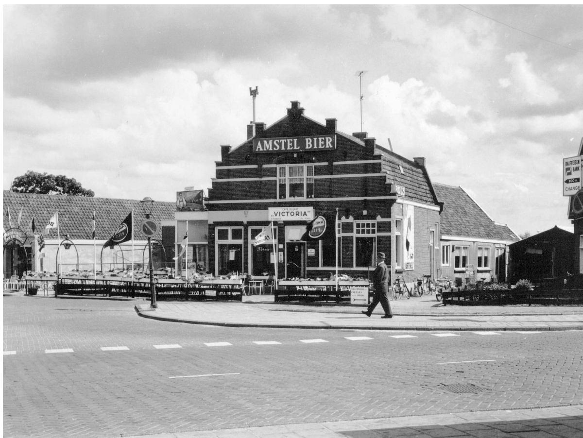
De naam is inmiddels gewijzigd in 'Café Biljart Victoria'. Er zijn meer gevelreclames verschenen en er is een terras op de straat. Verder is er in ruim