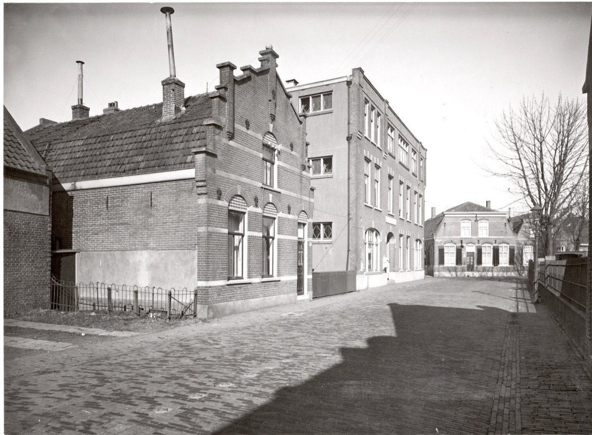
Akerpolderstraat 5 en 9; circa 1938.