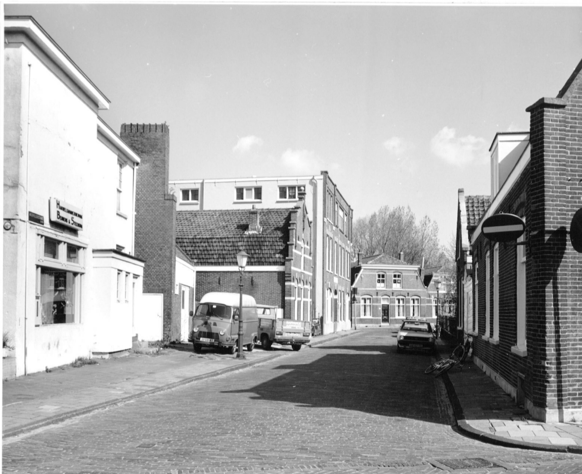
Akerpolderstraat gezien vanaf de Sloterweg, met links het in de jaren negentig door nieuwbouw vervangen pand; beeld uit de jaren zeventig.