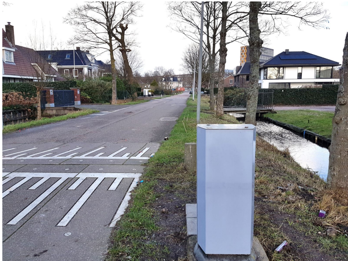
De onderste delen van de betaalpalen vallen niet op in het straatbeeld. Wie niet goed oplet denkt al snel dat het gaat om kastjes van KPN of Ziggo. februari 2024.