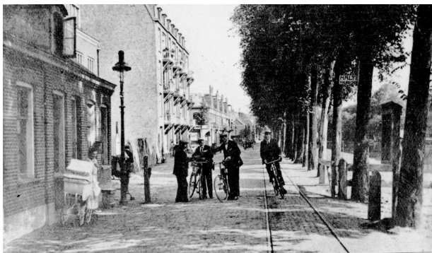
De tol op de Sloterkade; circa 1920.

Vanaf 1919 werd de Sloterweg steeds drukker vanwege de verbinding vanuit de stad met Schiphol. Toen in dat jaar de KLM werd opgericht, reisden luchtreizigers vanaf het KLM-kantoor op het Leidseplein per elektrische tram naar de Overtoomse Sluis. Vanaf daar ging de reis per paardentram over de Jacob Marisstraat, Sloterkade en Sloterweg naar de Sloterbrug bij Badhoevedorp, waarna de tocht langs de ringvaart werd voortgezet. Toen Amsterdam in 1921 de gemeente Sloten annexeerde duurde het nog twee jaar voordat de tolheffing werd beëindigd. Nu Sloten binnen Amsterdam viel vond de gemeente het niet langer juist om binnen zijn grenzen een weg te hebben die zonder betaling niet vrij toegankelijk was voor iedereen.