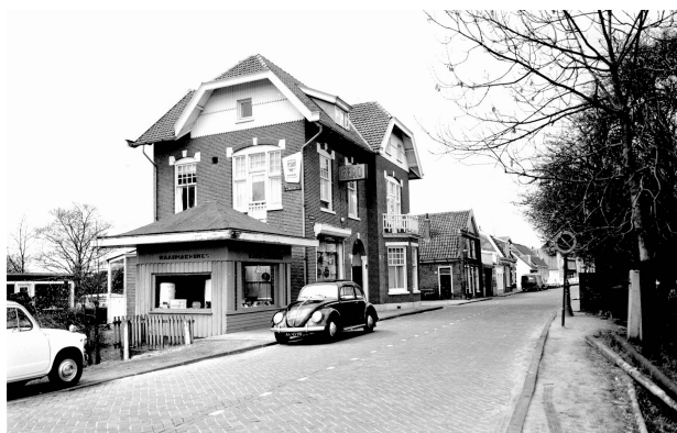
Het nog bestaande Tolhuis aan de Sloterweg, gezien in westelijke richting; april 1969.

bekroond met de afsluiting van de Sloterweg aan beide zijden. Een zogenoemde elektronische knip met cameracontrole is alleen nog te passeren door auto's van bewoners en bedrijven met ontheffing en de lijnbus van lijn 195. Wie toch op de Sloterweg moet zijn, zal moeten omrijden via een van de twee 'tolvrije' toegangswegen: de Louwesweg of de Anderlechtlaan. Behalve tussen 7 en 10 uur en tussen 16 en 19 uur kan dit ook vanaf de Plesmanlaan via de Laan van Vlaanderen.