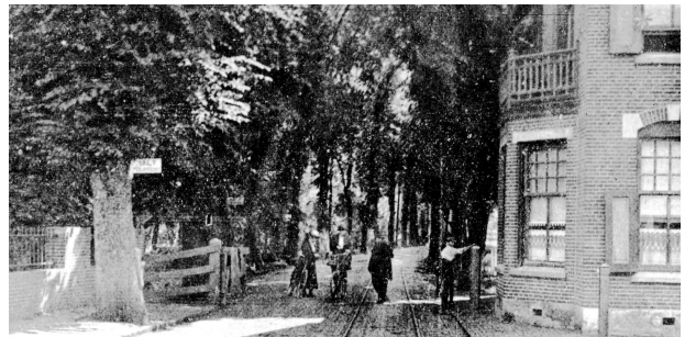
De tol bij het Tolhuis in Sloten; circa 1920.

kregen het zwaar te verduren. Toch duurde het nog tot 1938 totdat verkeer van en naar Schiphol en Den Haag niet langer steeds de nauwe dorpskern van Sloten moest passeren. In dat jaar werd een nieuwe brug in de (Oude) Haagseweg over de ringvaart in gebruik genomen waarvan de weg door de Riekerpolder liep en ter hoogte van de huidige Johan Huizingalaan werd aangesloten op de oude Sloterweg. Tussen deze aansluiting en de Aalsmeerweg werd de Sloterweg in de jaren '50 verbreed waarbij het oorspronkelijke karakter met zijn bomen, sloten en voortuinen verdween. Ook de naam van dit stuk werd toen gewijzigd in (later Oude) Haagseweg.