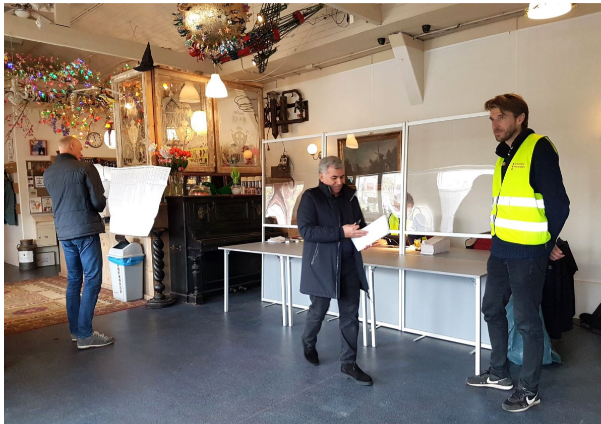
Wie dat wilde, kon na het stemmen meteen nog even wat drinken in de 'Tuin van Sloten'.