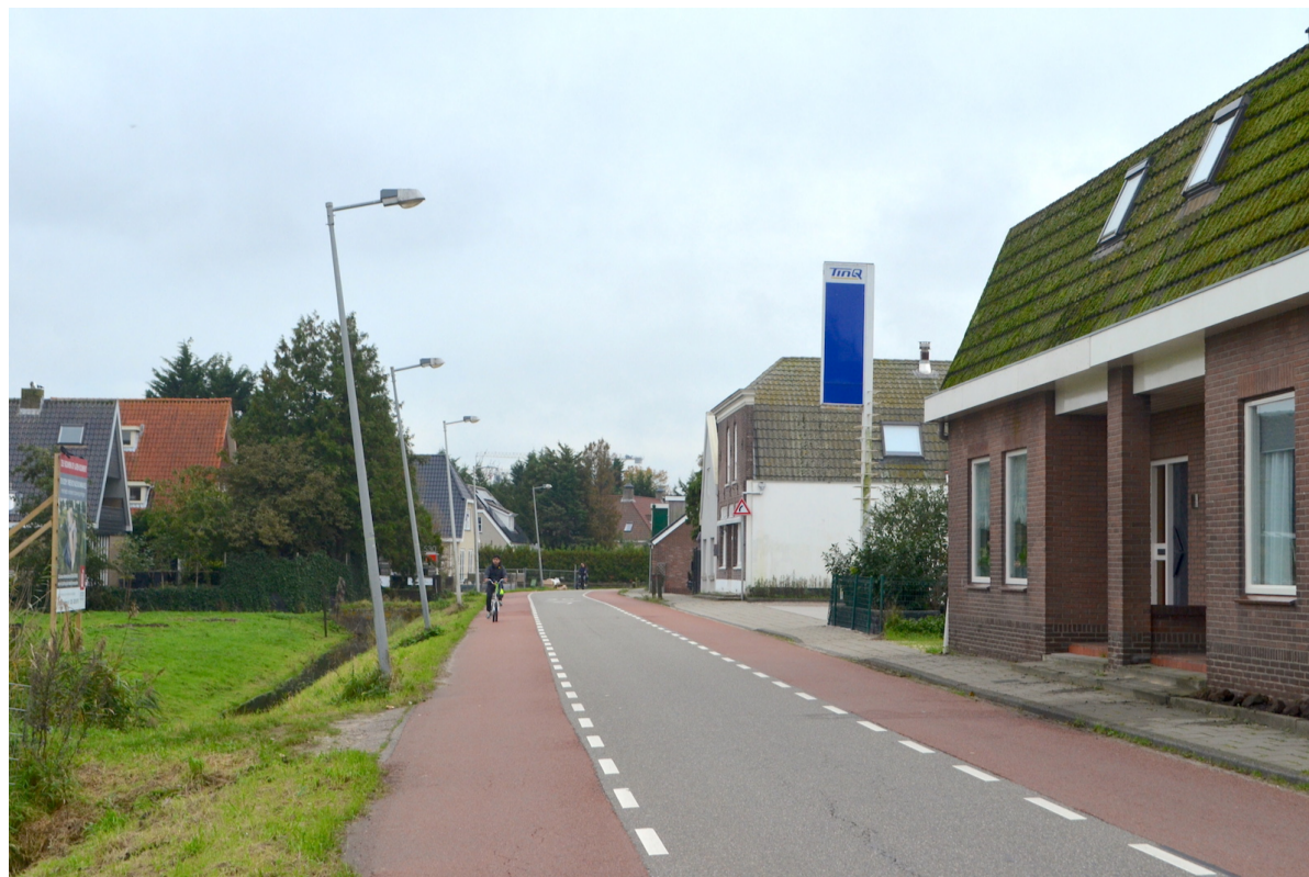
De nu van glad asfalt voorziene Osdorperweg t.h.v. nr. 557 is tegenwoordig een drukke verkeersweg; 23 oktober 2023.