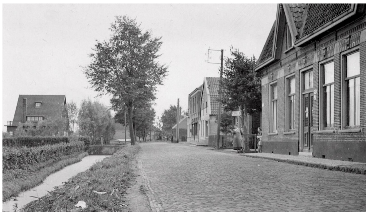
De nog stille weg met klinkerbestrating in de oude dorpskern van Osdorp; 1917.