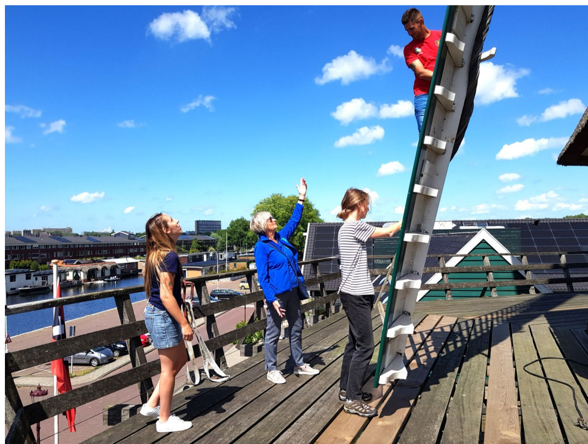
Vrijwilligers verzorgen persoonlijke rondleidingen.

Amsterdammers krijgen in november bij meer dan 100 locaties het tweede kaartje gratis. Dus voordelig naar theater, film, concerten en musea. Meld je nu aan via het formulier en kies uit het aanbod. November is toch geen toeristische topmaand en zo kan Amsterdam Marketing ook Amsterdammers voordelig laten genieten van de cultuur in de hoofdstad. Ontdek de actie van de Molen van Sloten en van de andere deelnemers . Op de website van 'I amsterdam' staat ook helder uitgelegd hoe u in drie stappen deelneemt aan deze actie.