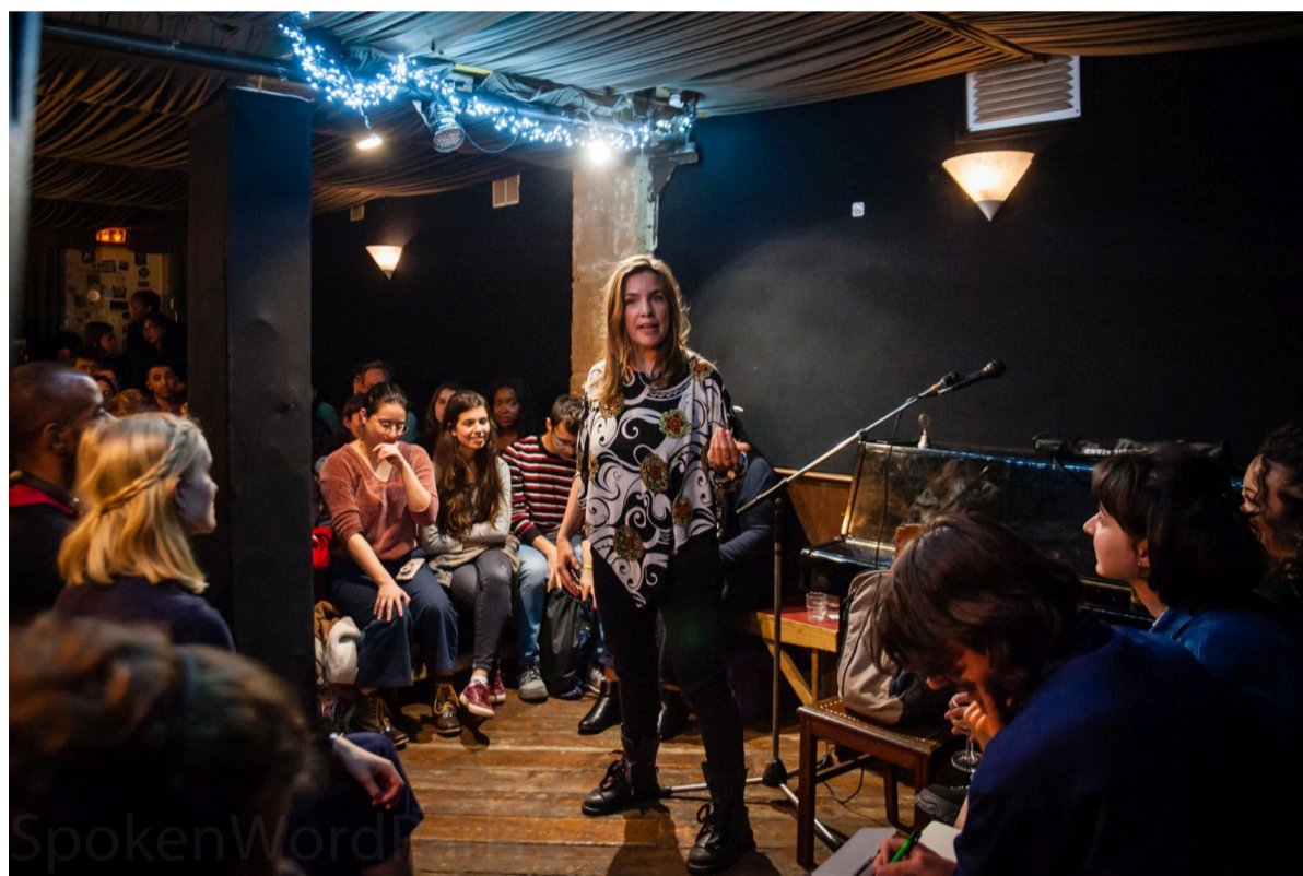
Tijdens een eerder optreden van Xina.

De verhalenavond biedt ook ruimte aan bewoners om zelf een verhaal of gedicht voor te dragen of om muziek te maken. Xina: "Ben je dichter, verteller, zanger of muzikant? Geef je op! Je optreden mag maximaal 10 minuten duren. Stuur dan een mail . We bieden graag ruimte aan lokaal talent. Via hetzelfde emailadres kunt u zich ook aanmelden voor de avond. Dan weten we voor hoeveel personen wij kunnen koken. Deelname is gratis, maar we waarderen donaties van rond de vier euro per persoon om de kosten van het eten te dekken, maar we willen dat onze activiteit toegankelijk is voor iedereen. Dus: kom vooral en geef wat je kunt en wilt."