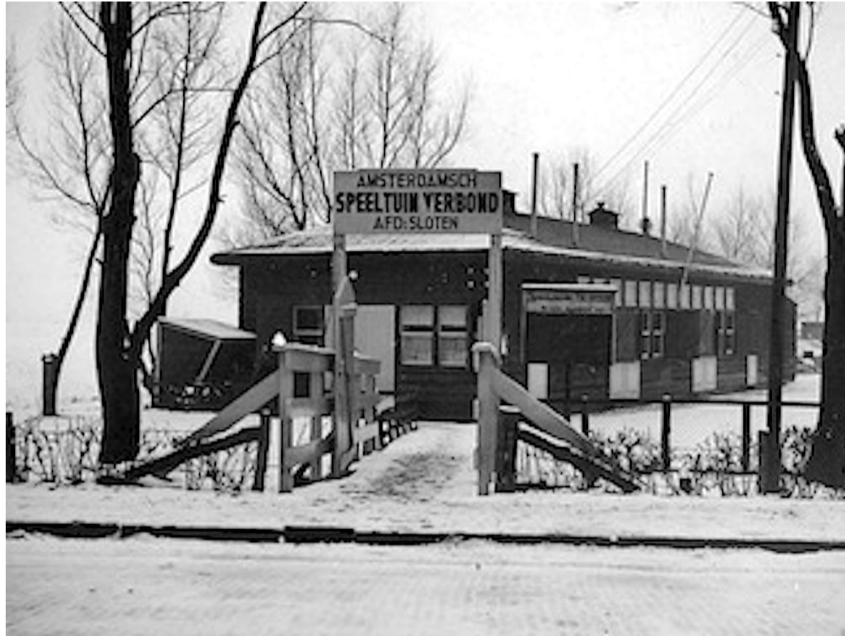
Amsterdamsch Speeltuin Verbond – Afdeling Sloten; jaren veertig.