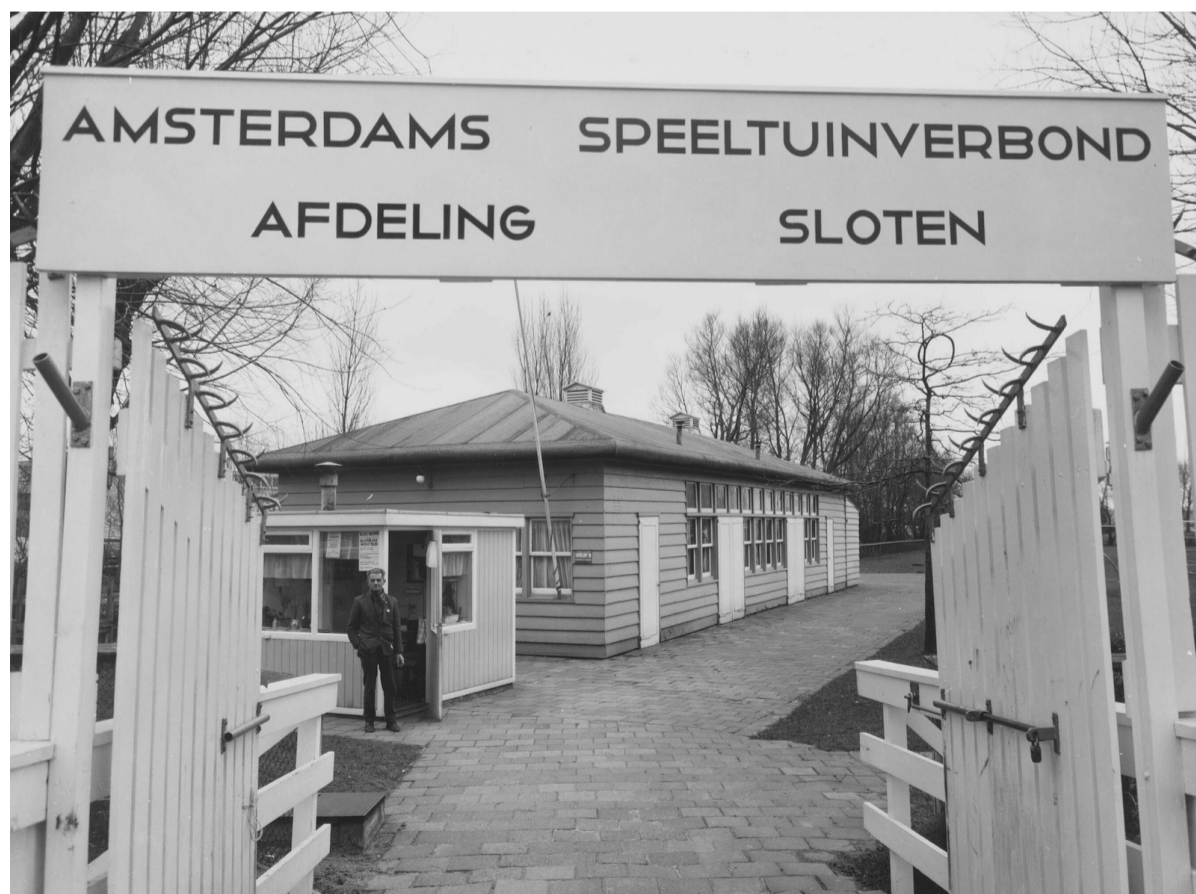
Het clubgebouw en beheerdershuisje met een duidelijk bord van het Amsterdams Speeltuin Verbond, Afdeling Sloten; 1969.