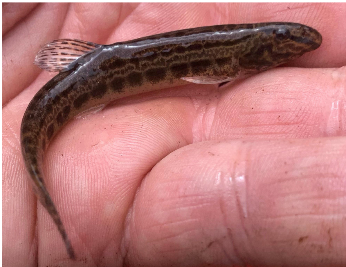
De kleine modderkruiper leeft in de sloten rond Natuurpark Vrije Geer. Beheerder en fotograaf Ruud Lutterlof: Het is een mooi visje, dat hier leeft tussen de waterplanten en in de modder van de sloten. In droge tijden kan de modderkruiper zich in de modder ingraven en zo overleven. Dit kunnen zij dankzij een speciaal ademhalingsorgaan.