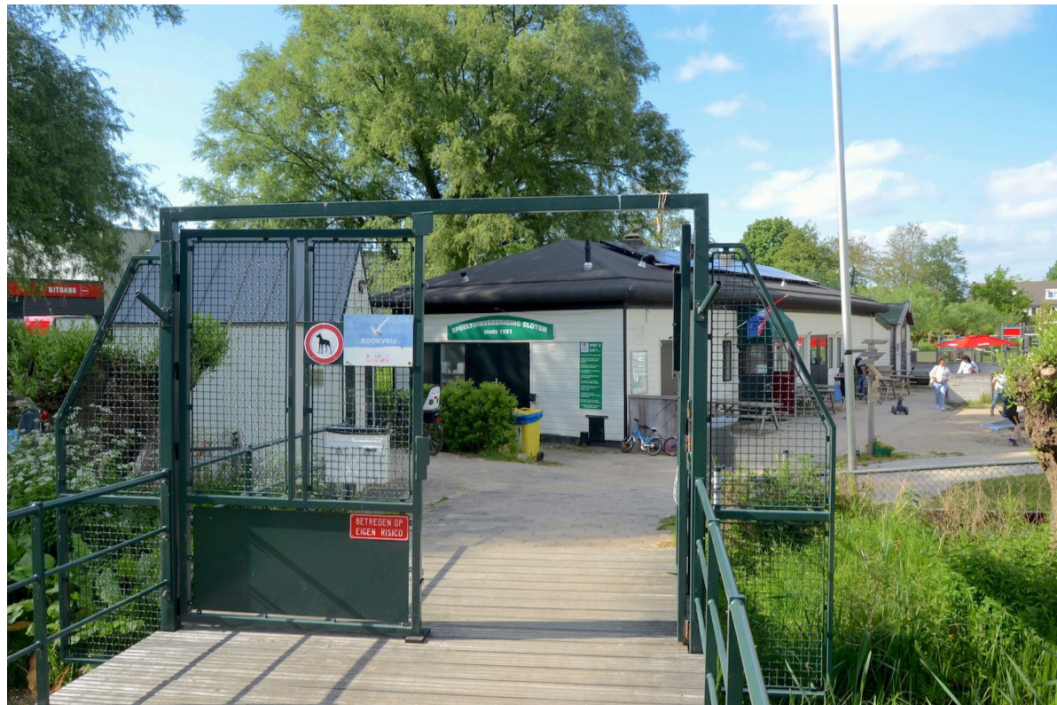
Een saai groen ijzeren hek - dat effectief vandalen kan weren - vormt nu de entree tot de Speeltuin Sloten; mei 2023.