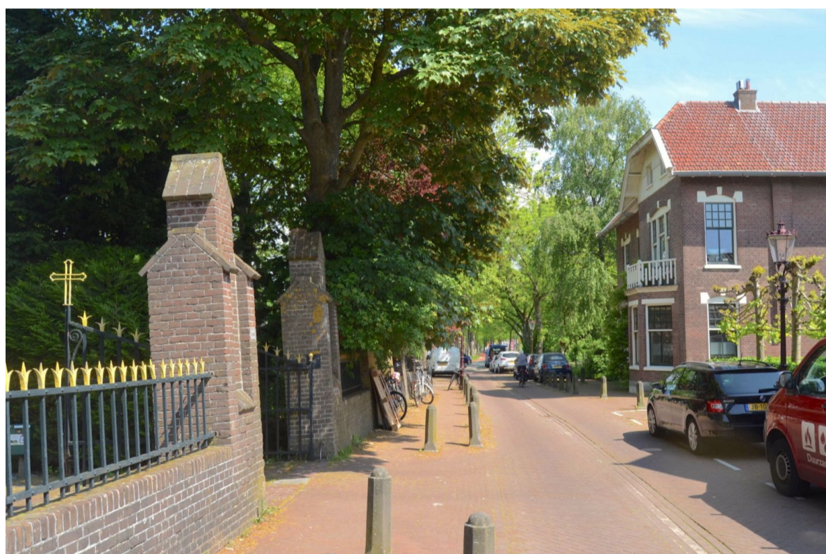
Foto uit mei 2023: Het tolhuis is goed herkenbaar en is grotendeels nog in oude staat bewaard. Het tolhek is dit jaar een eeuw geleden verdwenen. Daar kan iedereen nu gratis langsrijden. Nog steeds zijn er mooie bomen in de omgeving. Al vertoont de bomenrij langs de Sloterweg wel gaten. Het poortje van de Sint-Pancratiuskerk heeft geen overkapping meer, maar twee bakstenen pilaren. Het opgeknapte gietijzeren hek staat er mooi bij.

Foto uit het begin van de 20e eeuw. Hierop is het nieuwe, nog bestaande, tolhuis te zien. Het tolhek is gesloten. Het aantal bomen langs de fraaie weg is sindsdien fors afgenomen. Links is een overkapt toegangspoort te zien naar de in 1901 in gebruik genomen Sint-Pancratiuskerk en het kerkhof.