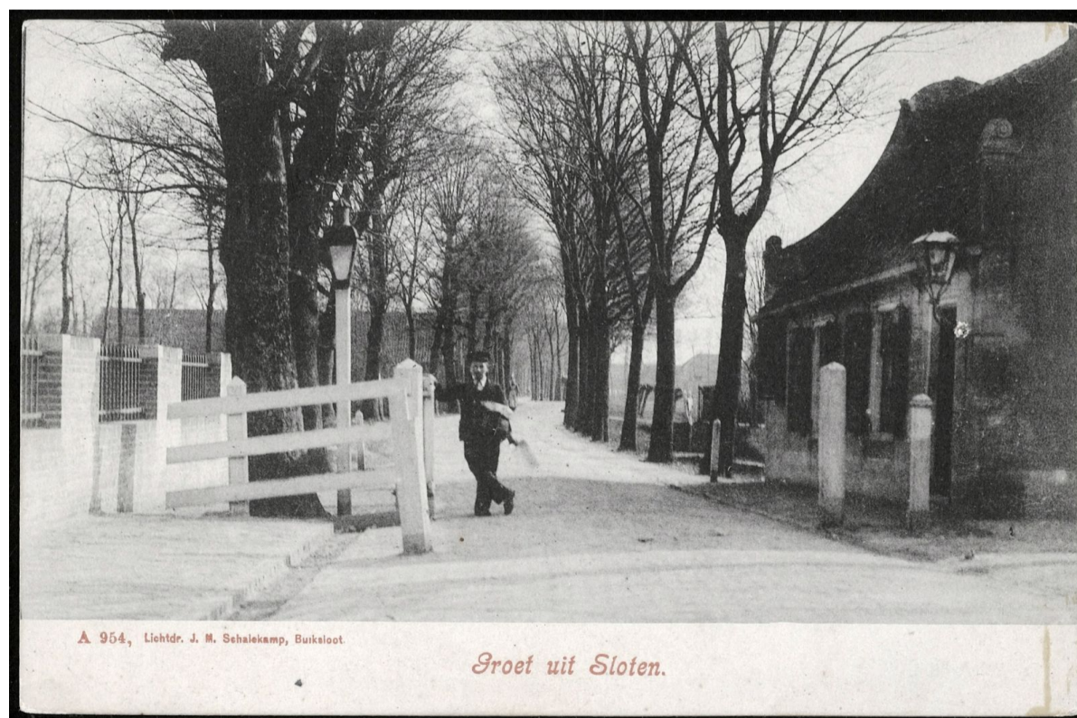
Het 19e-eeuwse tolhuis met het tolhek in geopende toestand. Ernaast zijn links en rechts nog mooie oude straatlantaarns te zien. De weg is omzoomd met fraaie bomen. Links de toen nog nieuwe muur rond de Sint-Pancratiuskerk uit 1901. Prentbriefkaart uit de Beeldbank Stadsarchief Amsterdam.

Wel iets meer dan de 10 cent voor een rij- of voertuig met vier wielen aan het begin van de 20e eeuw. Toen moest men voor een rijwiel nog 2 cent betalen, nu kan men met een fiets gratis over de Sloterweg blijven rijden.