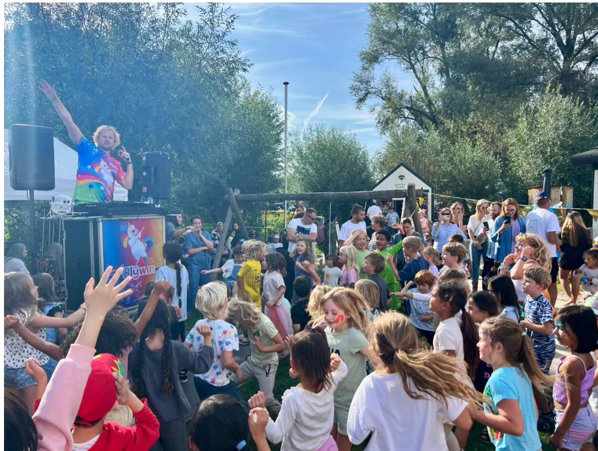
Op zaterdag 1 oktober vierde de Speeltuin Sloten zijn 102e verjaardag. Kinderen deden mee aan allerlei spelletjes, lieten zich schminken en deden massaal en fanatiek mee aan de kinderdisco.