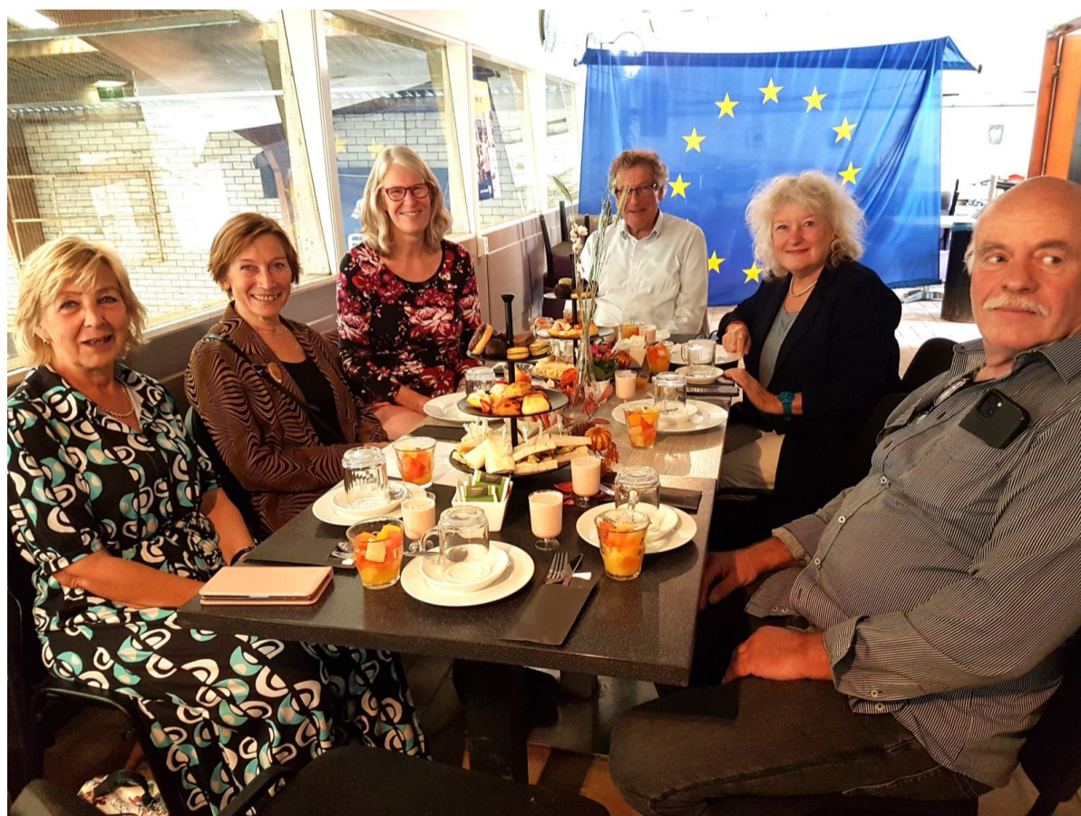
Gezellig samen genieten van al dat lekkers en ondertussen bijpraten, informatie uitwisselen en (verder) kennismaken.