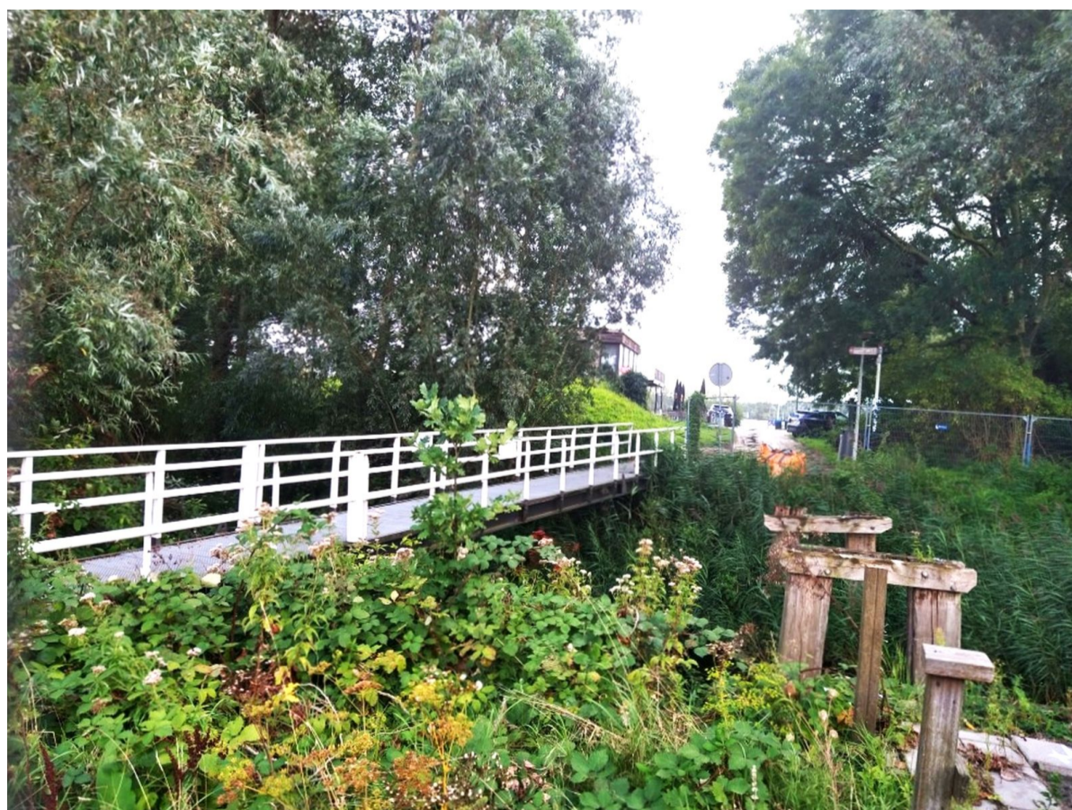
De huidige situatie van de te smalle brug naar De Oeverlanden met links de noodbrug en rechts de verrotte houten pijlers van de oude brug uit de jaren

Bovendien gaat de te smalle brug problemen opleveren wanneer de gemeentelijke 'Ontwikkelstrategie Landschapspark De Oeverlanden' straks wordt uitgevoerd. Hierin ligt namelijk vastgelegd dat het fietspad vanaf het parkeerterrein komt te vervallen. En als dat gebeurt, wordt de recreatiezone compleet onbereikbaar voor hulpdiensten. Onacceptabel natuurlijk. Er moet een veilige ontsluiting komen naar de steeds intensiever gebruikte recreatiezone."