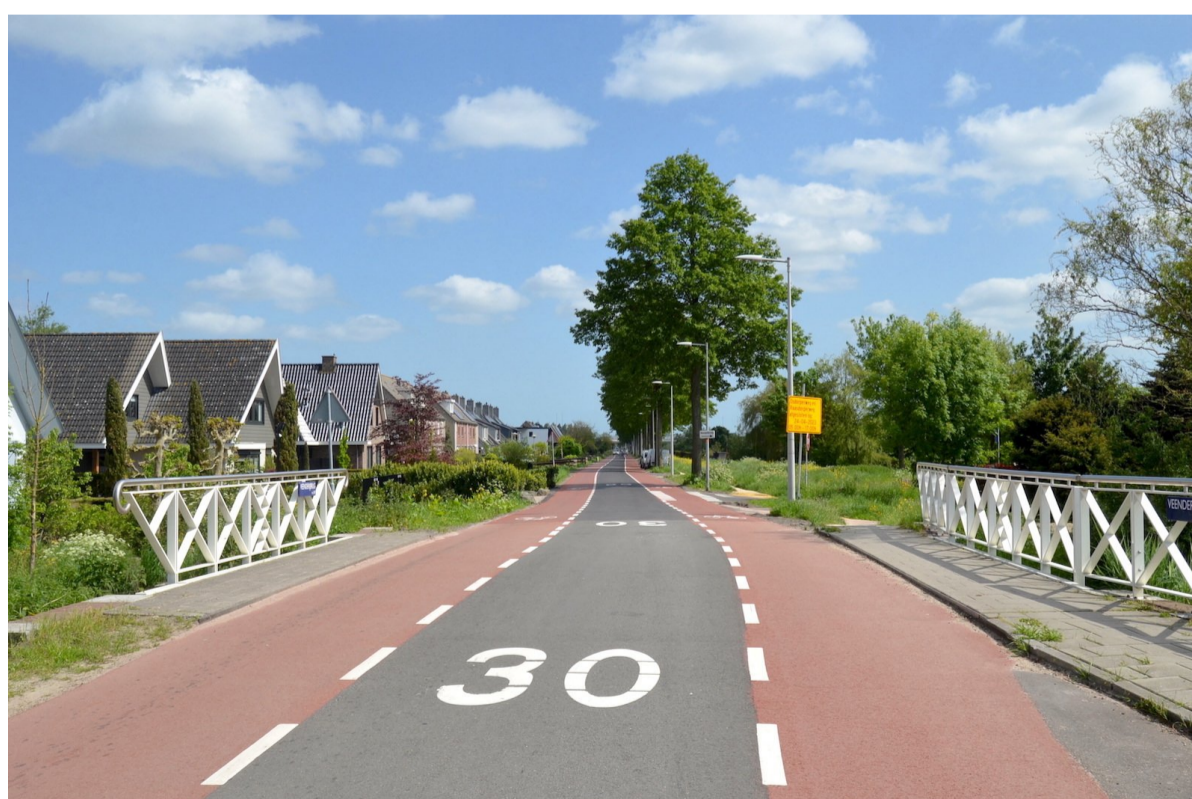
De nieuwste brug, de 'Veenderijbrug', met witte leuningen en het verse wegdek van de Osdorperweg in 2023.