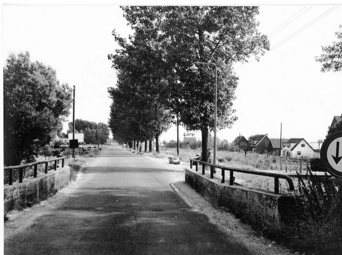
De betonnen brug uit de jaren veertig in 1967.