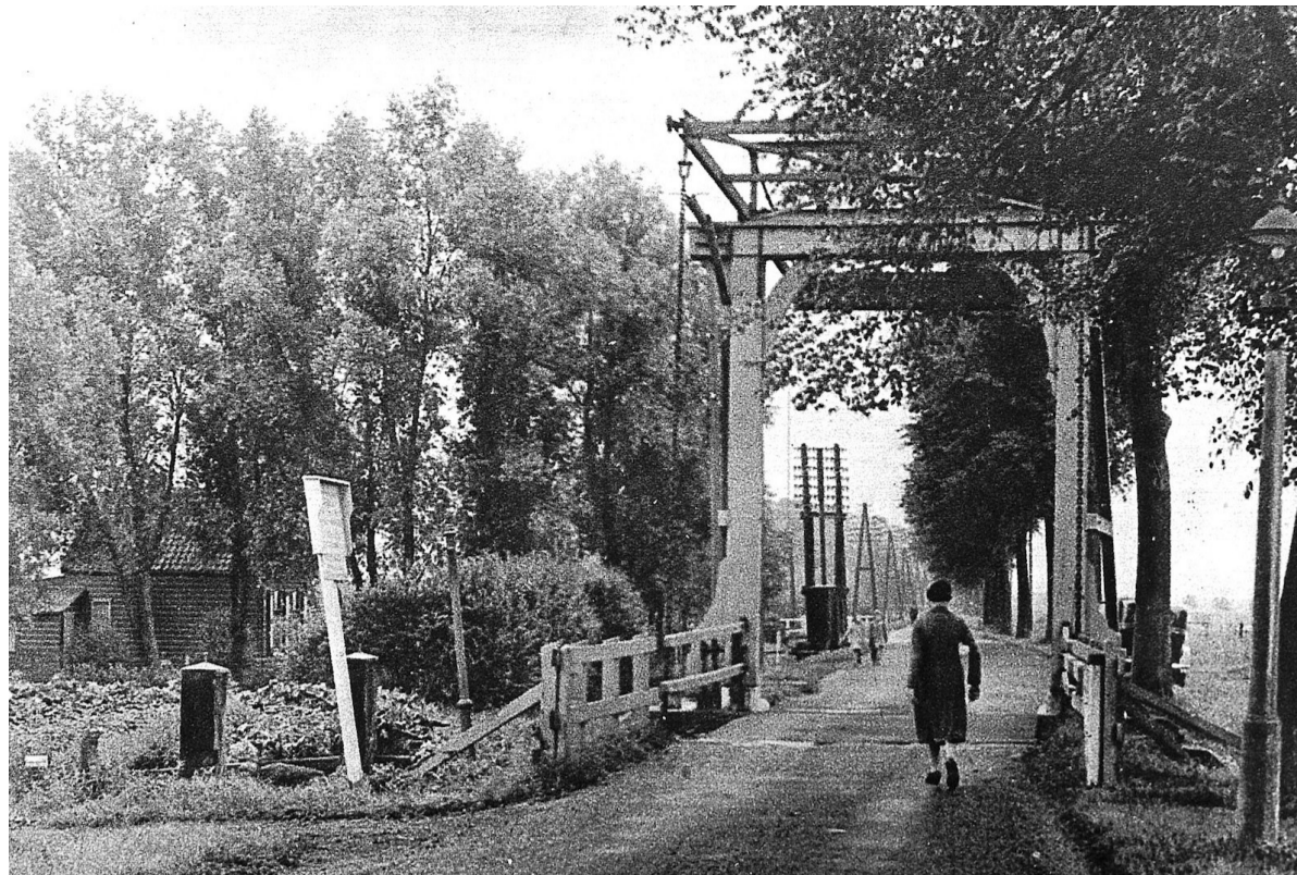
De houten ophaalbrug in de jaren twintig.