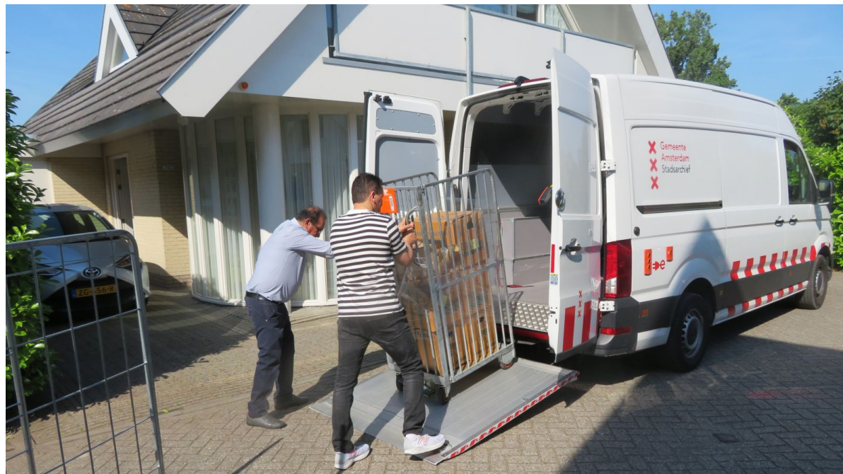
Het Stadsarchief Amsterdam kwam de dozen in Oud Osdorp ophalen.

moeite waard, omdat een groot deel van het archief betrekking heeft op het dorp Sloten van toen."