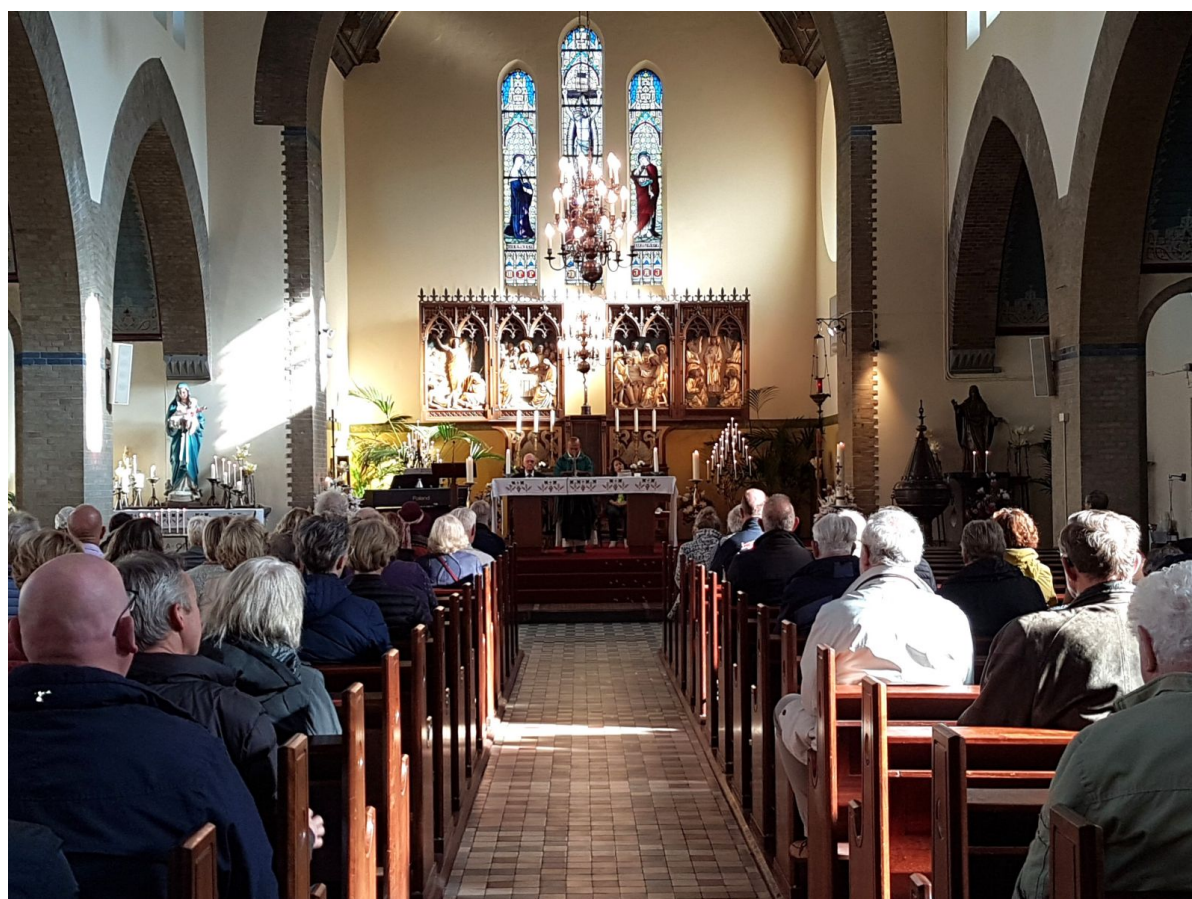
Tijdens de viering kunt u ook genieten van het mooie interieur met het