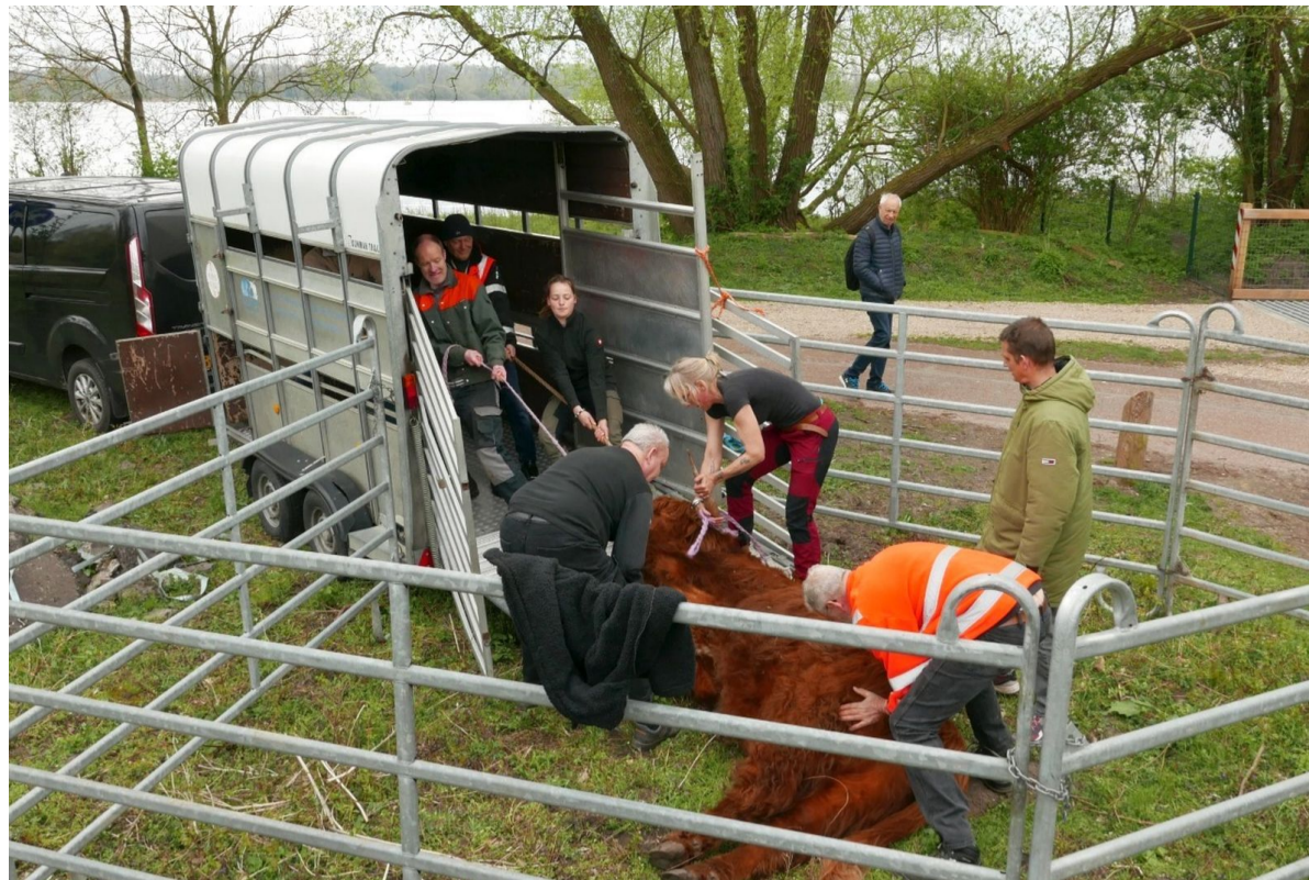
De grote stier is eerst verdoofd en daarna met vereende krachten in de aanhanger getrokken en geduwd.