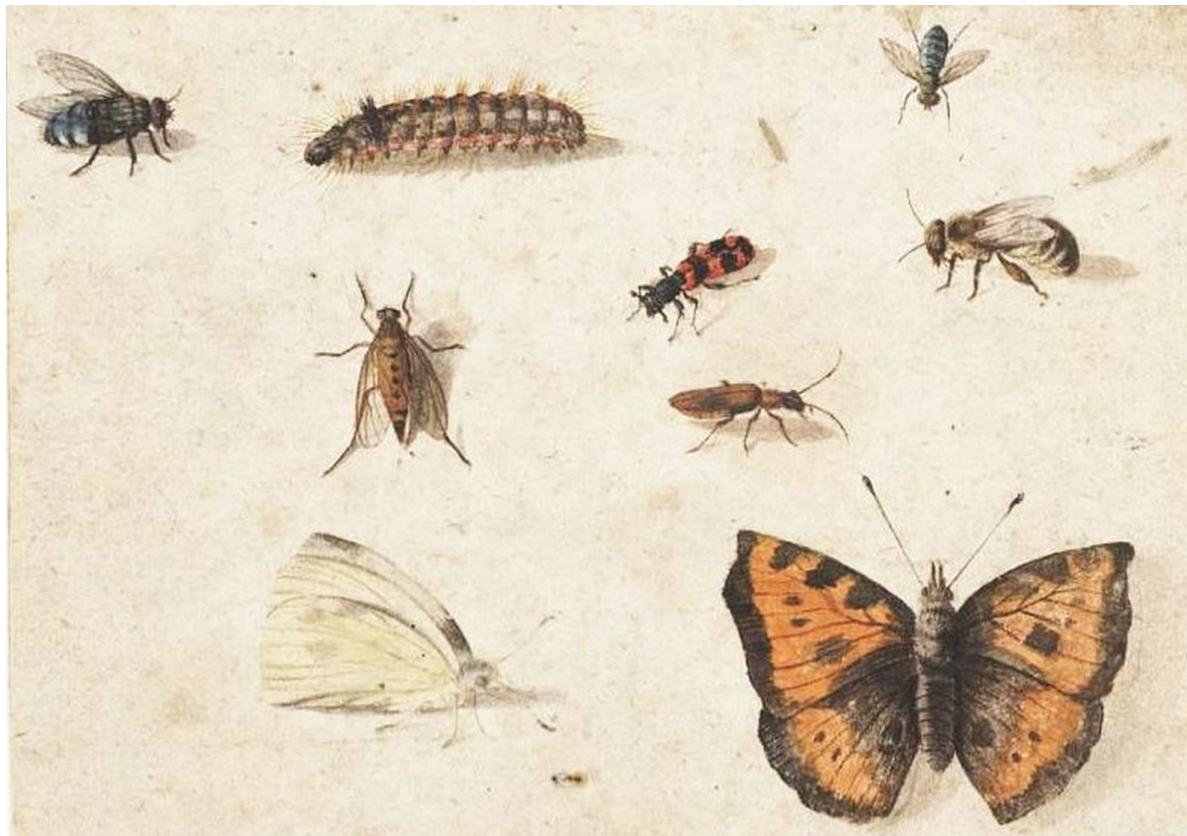
Evolutieplaatje. Afbeelding: Taxon Foundation.