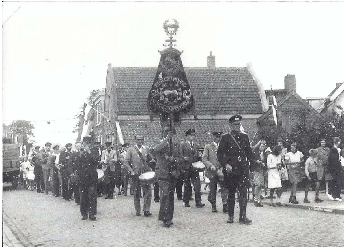
De Sloterweg ter hoogte van nummer 1242 in de jaren vijftig van de vorige eeuw en nu.