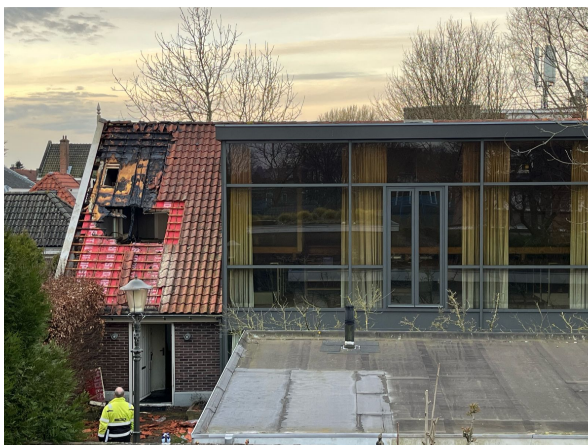
Op 17 maart ontstond er rond 5.30 uur 's morgens brand in de voormalige boerenschuur aan de Osdorperweg 21 in het hart van de Slotense dorpskern. Het pand staat leeg en is recentelijk in andere handen overgegaan. De brand is waarschijnlijk ontstaan door kortsluiting in de meterkast. Het vuur concentreerde zich in het dak, tussen de houten balken en de dakpannen. De brandweer heeft de angel uit het vuur gehaald door een stuk uit het dak te zagen. Aan de oude boerenschuur is in het verleden een reusachtige uitbouw gemaakt. In de tijd toen het dorp nog niet de status van 'Beschermd Dorpsgezicht' had, waren dergelijke beeldbepalende aanpassingen aan oude panden nog toegestaan.