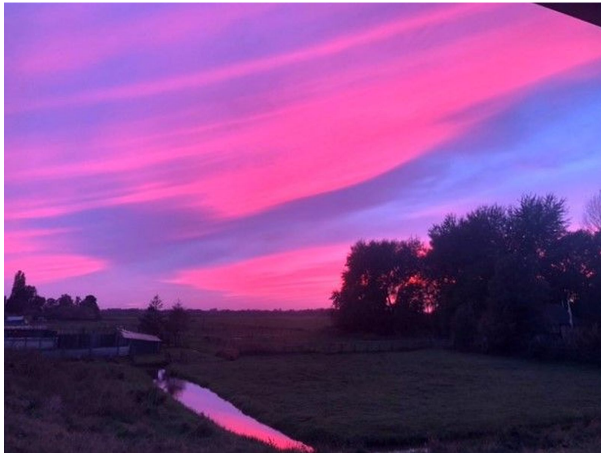
Magische zonsondergang boven de Osdorper Bovenpolder in Oud Osdorp.