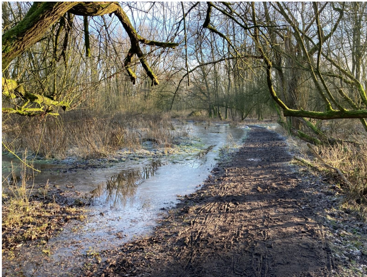
Een mysterieus sfeerbeeld van Natuurgebied De Oeverlanden in januari.