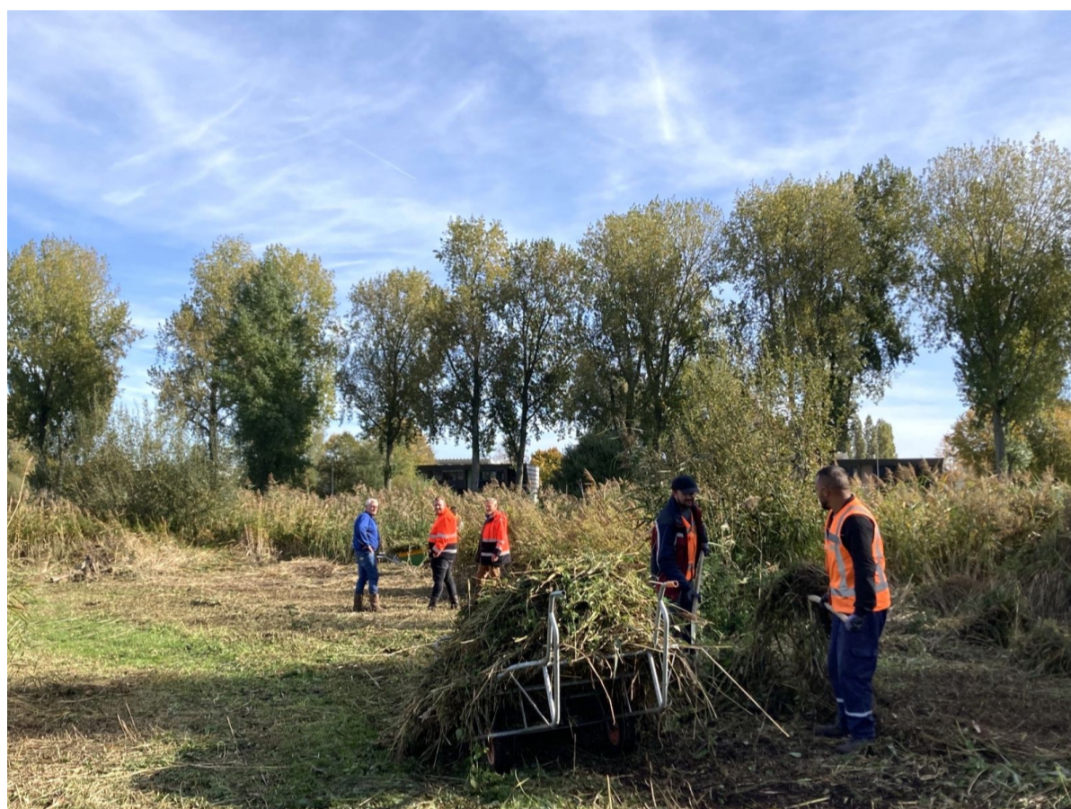
In de week van 17 oktober heeft de eco-aannemer van de gemeente samen met de beheerders van Natuurpark Vrije Geer het Schapenland gemaaid. Boer Ton had zijn schapen al opgehaald. Ook dat ene eigenwijze schaap liet zich dit jaar gelukkig mak met wat eten lokken. Het maaiwerk was door de nattigheid wel zwaar, maar toch goed getimed: Alle planten hebben, voor ze gemaaid werden, eerst hun zaad kunnen afzetten. Komend voorjaar hebben de zaailingen nu lucht en ruimte om hier te groeien en bloeien. Een derde van de begroeiing op de Schapenweide is blijven staan en kan dus onderdak blijven bieden aan kleine zoogdieren en de populatie dwergmuizen die hier al jaren woont. Ook de watersnippen hebben nu voldoende ruimte én dekking om hier te overwinteren.