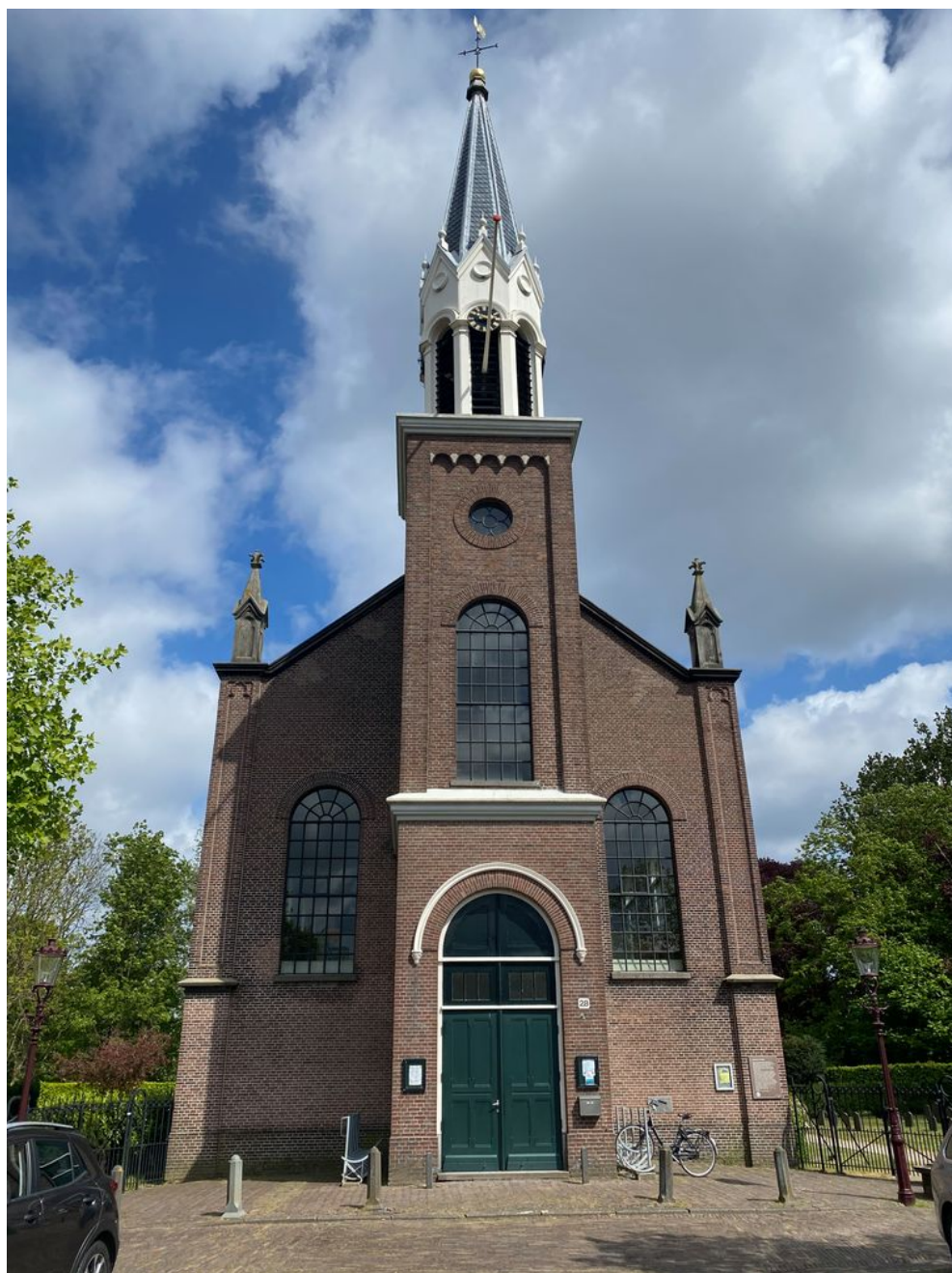
De Sloterkerk.

‘Wie kunnen we in godsnaam bellen hiervoor,’ schreef een wanhopige buurtbewoner midden in de nacht op Facebook. Volgens onofficiële metingen luidden de kerkklokken in totaal 33 minuten: van 01.54 tot 02.27 uur. Buurtbewoners belden de politie, maar die wisten ook niet wat te doen. “Ze wisten dat het de Sloterkerk was,” zegt Hester, die niet met haar achternaam in de