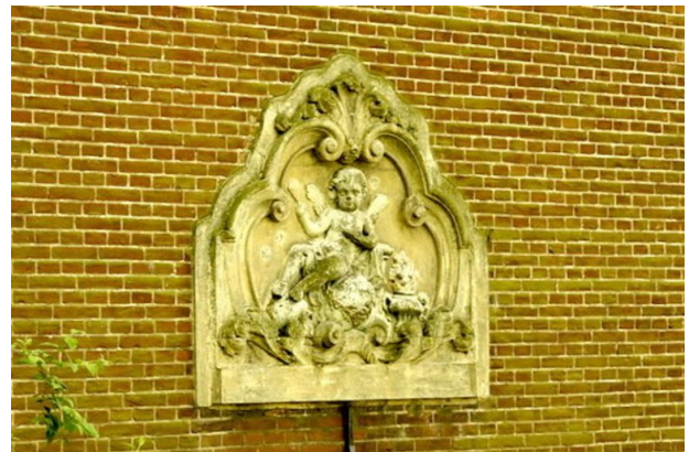
Homo bulla bij Huis te Vraag.

deeld in zestien secties en vier klassen. Tegen het talud dat nu was ontstaan, liet Oosterhuis een aula annex beheerderswoning bouwen. In de voorste zijgevel werd de gevelsteen van het afgebroken landhuis geplaatst. Op de gevelsteen is een homo bulla te zien waarvan de beltenblazende cupido de ijdelheid der dingen symboliseert. De luchtbellen, de aardbol waarop de cupido zit alsmede de vuurpot en het water aan zijn voeten staan voor de vier elementen van het universum. Dat past goed bij de metaforische sfeer van de begraafplaats.