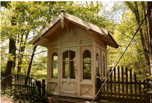
Bloemenkransenhuisje bij Huis te Vraag.

Het terrein werd vanaf 1987 beheerd door de Nieuwe Oosterbegraafplaats, vanaf januari 1991 door stadsdeel Amsterdam-Zuid dat in 1998 opging in het stadsdeel Oud-Zuid en in 2010 in stadsdeel Amsterdam Zuid. Nadat in 1991 een nieuwe Wet op de lijkbezorging van kracht werd, bleek dat de grafurust nog verlengd moest worden tot 2012, alvorens men kon gaan ruimen. Zover zou het echter niet komen want ondertussen is er wat bijzonders gebeurd.