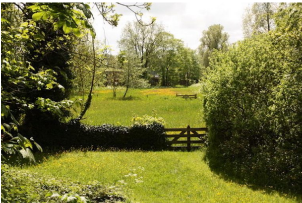
Uitzicht vanaf Huis te Vraag.

Bij het veerhuis kon men zogezegd ook terecht voor inlichtingen, iets waar de uitbater van het veerhuis de aandacht op vestigde met behulp van een bord langs de weg met de tekst 'te Vraghe' wat zoveel betekende als 'hier kun je iets vragen'. Toen Groothertog Maximiliaan van Oostenrijk in 1486 of 1489 een bedevaart deed naar Amsterdam zou hij hier de weg hebben gevraagd. Vanaf die dag heette de herberg