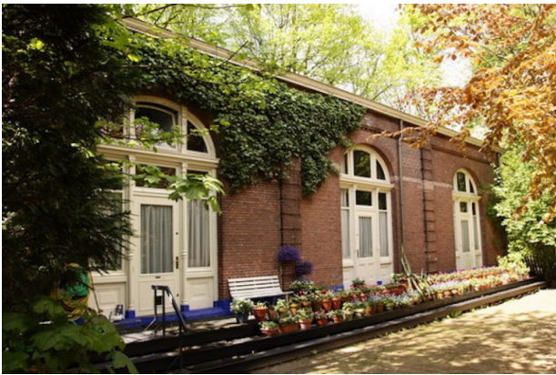
Aula van Huis te Vraag.

dus op de linten lezen voor wie de grafkransen waren. Zulke huisjes zullen vaker gebouwd zijn op begraafplaatsen, maar dit is de enige in zijn soort die bewaard is. Ten onrechte wordt het huisje ook wel aangewezen als een lijkenhuisje, maar dat is onmogelijk omdat het huisje veel te open is.