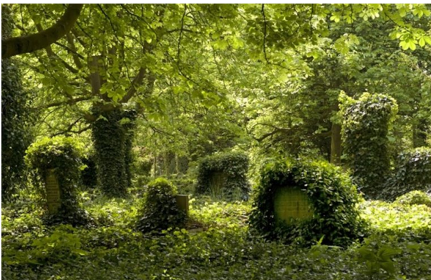
In 1962 sloot de begraafplaats.

belangrijk, omdat de grond dan met een boot gemakkelijk kon worden aangevoerd. Niet alles is verloren gegaan bij de sloop van het landhuis. Een gevelstuk is gebruikt bij de bouw van de aula annex beheerderswoning en bevindt zich in een zijgevel. Ook de naam Huis te Vraag is niet verloren gegaan. Ondanks dat Oosterhuis de naam ongeschikt vond voor de begraafplaats en deze de Protestantse Begraafplaats te Vraag noemde, bleef het in de volksmond Huis te Vraag heten. De opening vond plaats op 24 september 1891.