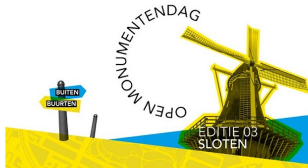
Open Monumentendag 2021 – Editie 03 – Sloten

begraafplaats wordt nu onderhouden door 2 tuinvrouwen en een aantal vrijwilligers onder auspiciën van de gemeente Amsterdam.