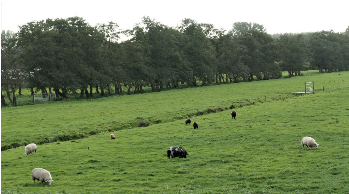
Fraai landelijk Osdorp met open zicht op het achterland.

U ontvangt deze nieuwsbrief omdat u zich hiervoor hebt ingeschreven bij www.slotenoudosdorp.nl .