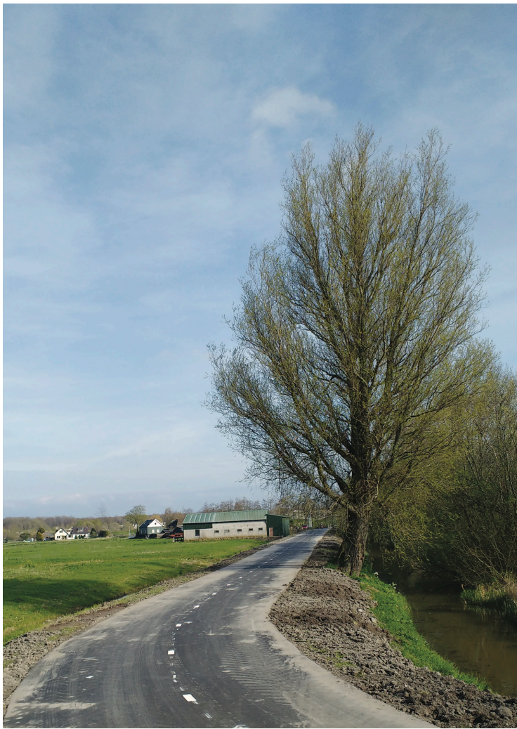
Koekoekslaantje met de schietwilg