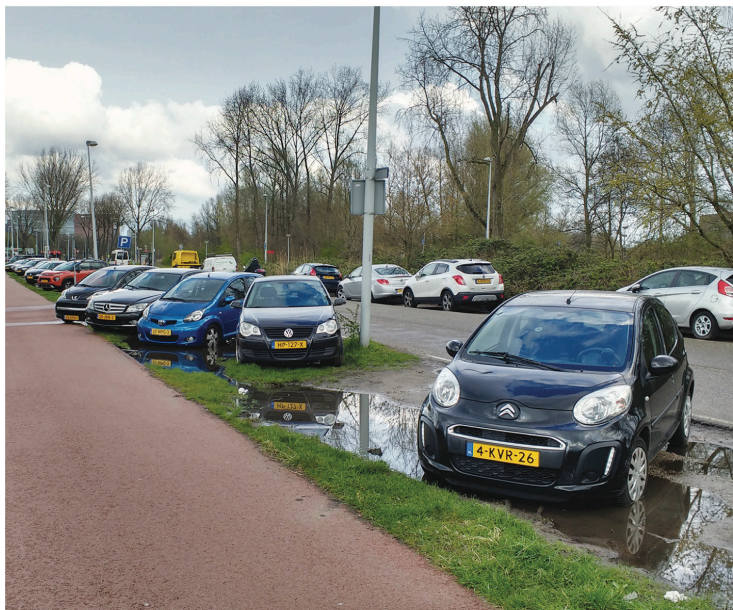
Oude Haagseweg met kapot geparkeerde berm