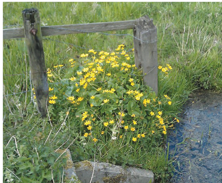
Dotterbloemen in de Riekerpolder