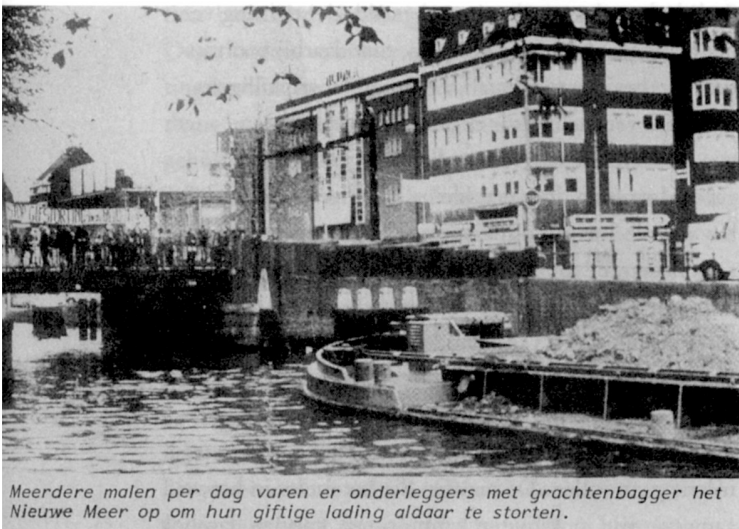
Meerdere malen per dag varen er onderleggers met grachtenbagger het Nieuwe Meer op om hun giftige lading aldaar te storten.