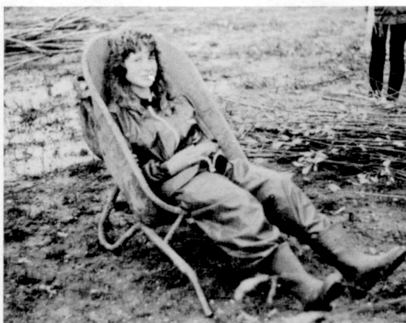
Een leerling van de tuinbouwschool neemt het er even van tijdens een korte pauze (1987).