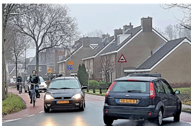
De Sloterweg (Hoofdnet Fiets) is zéér gevaarlijk voor fietsers...