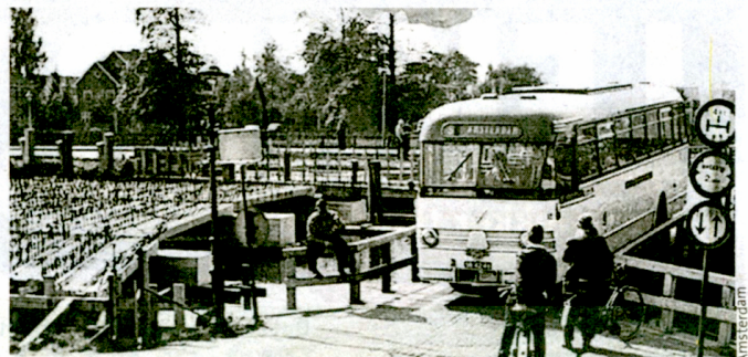
De lijnbus van Maarse & Kroon wurmt zich over de versleten brug. De huidige brug is in aanbouw.