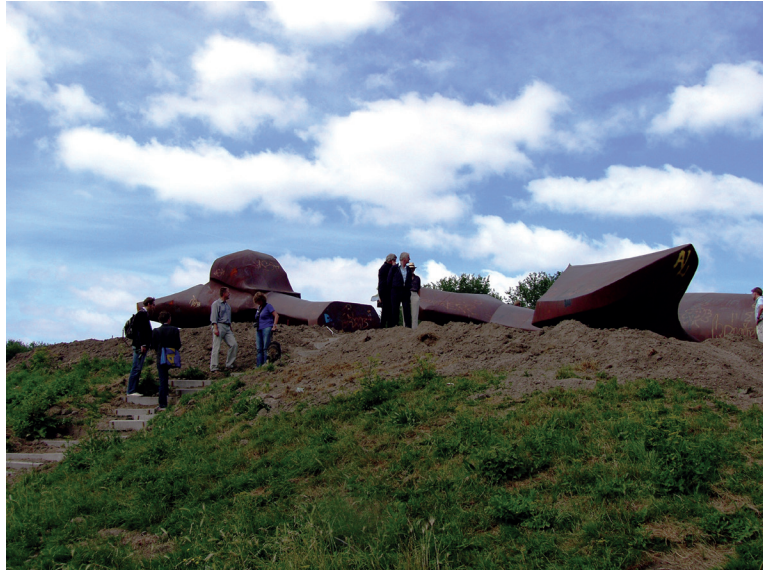
WESSEL COUZIJN, GROOT LANDSCHAP [2006]

De plek van de crash wordt in de bronnen die ik gebruikte aangeduid met: 7 km. Noordnoordoost van Schiphol 2 en Sloterdijkmeerweg. 3 Die weg liep door het midden van de polder, en daarmee van de huidige Sloterplas. Maar Samuel verklaarde dat het om het adres Sloterdijkmeerweg 181 ging. Dat is in het huidige Slotervaart. De boerderij van de bewoners lag net als de hoeve van Van den Broek ver van de weg af, bij de ringvaart rond de polder. Nr. 181 lag zelfs aan de overkant van de vaart, buiten de oude Sloterdijkmeer. De zware Duitse bommenwerper boorde zich op 20 oktober 1941 in de oever van de ringvaart, ergens tussen nr. 181 en de nu omgebouwde maar herkenbare Water-